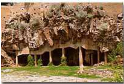
GROTTA di San Michele

rimando alla dea Diana), i Dolmen e i Menhir. Le Domus de Janas sono tombe scavate nella roccia 9 e hanno l'aspetto di case sotterranee con diverse stanze e in molti casi danno accesso a necropoli sotterranee ramificate. Ma è solo con la terza fase del Neolitico (Neolitico finale, tra il 3.200 e il 2.800 a C. ) che, secondo gli archeologi, viene per la prima volta a esprimersi una cultura strutturata e diffusa sull'intera superficie dell'isola. È un periodo di forte crescita demografica, quindi di benessere e espansione, che porta all'estensione e alla crescita numerica dei villaggi. Accanto alle Domus de Janas si diffondono altre tipologie di tombe: compaiono tombe a circolo, a corridoio, mentre alle statuette steatopigie della dea, tendono a sostituirsi sempre più gli idoletti fortemente stilizzati, con la caratteristica forma a croce.