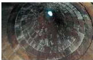
pozzo di Santa Cristina imboccatura della tholos