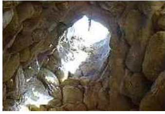
Pozzo di Tatinu (Nuxis)

Se affianchiamo le immagini, scopriamo non senza stupore che la visione del dipinto è molto simile a quella che avremmo collocandoci sul fondo di un pozzo sacro. E' straordinaria la convergenza con la struttura dei pozzi sardi, nei quali il canale del pozzo si congiunge alla tholos che è la cavità rotondeggiante a forma di vaso. Il dipinto suggerisce anche che per compiere questo cammino occorre essere nella giusta prospettiva. Infatti, quando ci troviamo a livello del terreno, vediamo la realtà, ma la nostra visione è dispersa, siamo distratti da molti stimoli; stare sulla superficie del terreno non consente una visione focalizzata: se non fossimo dentro a un canale buio la via di accesso all'aldilà non sarebbe visibile. Il motivo di questa esclusione è forse molto più "profondo" e lo svela il quadro di Bosch. Guardare il cielo per gli antichi aveva il significato di esservi proiettati dentro, venire in contatto con l'elemento sacro, partecipare della sua potenza 163 . Ma non si poteva avere ovunque. Vi erano dei luoghi particolari in cui il sacro si manifestava e occorreva essere scesi nelle profondità di se stessi: e dall'interno di un pozzo si può solo guardare in alto verso il cielo, il futuro, il compimento celeste: restare focalizzati sulla luce che guida, permeati dal sacro. Il cerchio fornisce anche l'idea del limite. Per focalizzare dobbiamo restringere il campo, mettere tutta la nostra attenzione in un punto ed escludere il resto.