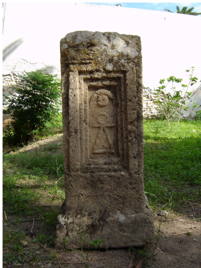
Simbolo dea Tanit

confutano questa tesi, è il fatto che alcuni esemplari di pozzi hanno una copertura, altri ne mostrano i resti. La presenza di una copertura non avrebbe consentito né alla luna né al sole di illuminare l'interno dei pozzi. Questo fatto scarterebbe qualunque significato astronomico. In ogni caso siamo di fronte a una questione che va ben oltre le attuali conoscenze, trovo utile richiamare alla constatazione che l'allineamento astronomico è evidente, che fosse stato realizzato consapevolmente o per un inconscia capacità dell'uomo antico di allineare il monumento sacro alla posizione degli astri. Lo stesso discorso dee essere fatto per i motivi simbolici ricorrenti, come per esempio l'impressionante relazione di somiglianza tra il simbolo della dea fenicia Tanit , rappresentata da un cerchio in cima a un triangolo e la fotografia aerea scattata sopra al pozzo di Santa Cristina. Le due immagini mostrano una grande somiglianza, ma il simbolo diventa sovrapponibile al disegno stilizzato del pozzo.