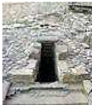
Pozzo di santa Anastasia Funtana de is dolus

Sempre associato al nome di una santa Cristina, Santa Anastasia e associato alla costruzione di una chiesetta tardogotica, si trova un altro interessante tempio a pozzo, situato presso una sorgente di acque curative. Il tempio a pozzo di S.Anastasia, Funtana de is dolus scoperto nel 1913, lungo circa 12 metri, è realizzato con blocchi in basalto e costituito da una camera a pianta circolare profondamente scavata nel suolo, coperta a tholos cui si accede mediante una scalinata di 2,20 m di altezza. In epoca più tarda fu aggiunta una facciata decorata, su conci di calcare.