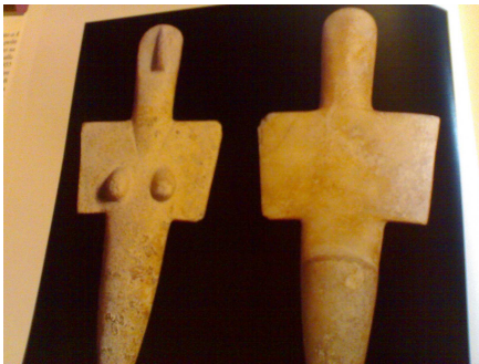
Statuetta stilizzata (museo di Cagliari)

La prima età del bronzo (Eneolitico, dalla parola Aeneus , bronzo e lithos , pietra) in Sardegna si colloca tra il 2.800 e il 2.600 a C. e segna la nuova capacità di estrarre e lavorare i metalli di cui la Sardegna è ricchissima. Le prime tracce dell'Eneolitico sono state rinvenute nel cagliaritano. A questa fase viene ricondotto il monumento, fino a questo momento sembra,