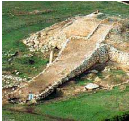
Ziqqurath di Monte d'Accoddi

isolato, di Monte d'Accoddi, unico esempio di costruzione in Europa che riprende la struttura delle Ziggurat 10 .