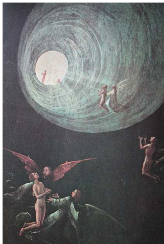
Polittico delle "Visioni dell'Aldilà" di Hieronymus Bosh.

Contattiamo la profondità, che ritroviamo nel dipinto di Hieronymus Bosch, «Visioni dell'aldilà» del 1504. L'immagine mostra la via che dà accesso al mondo ultraterreno, percorso che ha la forma e la profondità di un pozzo.