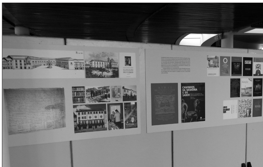
Foto 4 – A Universidade e a Cultura (Painéis 6 e 7). Exposição no Campus de Gualtar, átrio do Complexo Pedagógico 2.