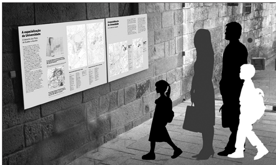
Foto 3 – A Especialização da Universidade (Painel 11); Instalações Definitivas (Painel 12).