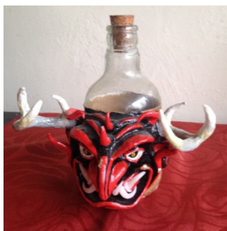
Figura 2: Botella del diablo (varios 2014). Colección: Colectivo La Minga