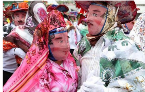
Figura 3: Comparsa con caretas: parejas de línea y capariche

La guaricha, de igual manera, tapa su rostro con pañuelos y caretas de alambre, como utilería puede llevar un acial, una cartera o un muñeco de felpa, ya sea de representación humana, animal o fantasía; este por lo regular es descuidado, sucio o desnudo. Por otra parte, el capariche, cubierto con careta de alambre y guantes blancos, lleva una escoba de gran tamaño confeccionada con retama negra y seca propia de la zona, sus dimensiones oscilan entre los 90 a 100 cm, la parte inferior y el palo que los sujeta de unos 50 cm llega a medir entre 140 a 150 cm; en ocasiones las decoran con cintas y flores. Las parejas de línea, hombres y mujeres, tienen un pañuelo blanco que lo agitan durante la danza, no poseen utilería, pero su coreografía es preparada por semanas antes de la festividad.