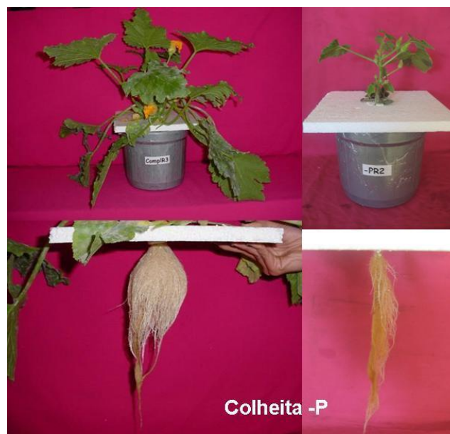
Figura 3. Comparação da parte aérea e raiz das plantas sob omissão de Fósforo (esq) e tratamento completo (dir). Lavras – MG.

As plantas do tratamento -P também começaram a apresentar sintomas no sexto dia, com diminuição no crescimento e porte das folhas. As folhas mais velhas apresentaram-se menores e levemente mais escuras (Figuras 3 e 4). Com os avanços dos sintomas tornaram-se necróticas em alguns pontos. De acordo com Fernandes et al. (2005) sintomas semelhantes foram observados em plantas de maxixe-do-reino.