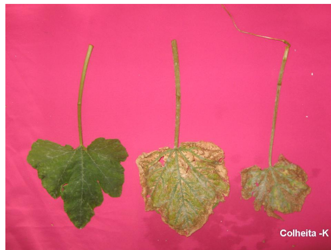
Figura 6. Evolução dos sintomas nas folhas dos tratamentos sob omissão de Potássio na colheita. Lavras – MG.