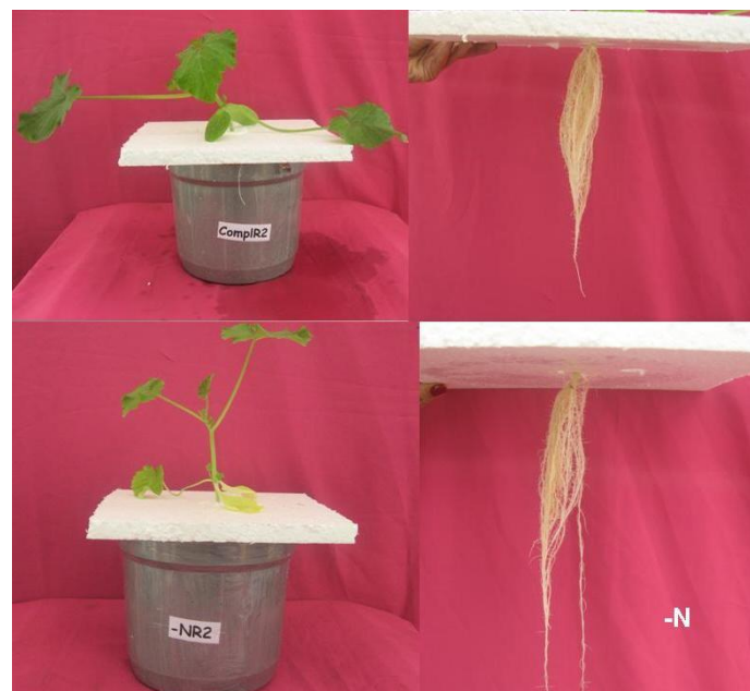
Figura 1. Comparação da parte aérea e raiz das plantas sob omissão de Nitrogênio (abaixo) e tratamento completo (acima). Lavras – MG.

Plantas sob omissão de N começaram a apresentar sintomas a partir do sexto dia. Inicialmente, apresentaram uma clorose generalizada nas folhas mais velhas, e com a evolução dos sintomas as folhas mais novas apresentaram os mesmos sintomas (Figuras 1 e 2). As plantas exibiram lento crescimento, folhas menores, hastes mais finas e mais claras em comparação ao tratamento completo, da mesma forma o sistema radicular. O nitrogênio (N), em geral, é o nutriente mais requerido pelos vegetais e o mais limitante em relação ao crescimento (Souza et al. 2015). Epstein & Bloom, (2004), complementam que a deficiência de N é a mais limitante para as plantas, sendo os principais sintomas a clorose generalizada e o crescimento reduzido.