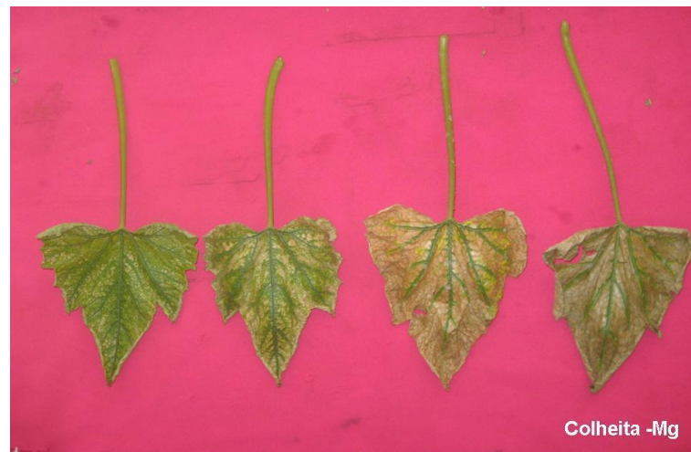
Figura 10. Evolução dos sintomas nas folhas dos tratamentos sob omissão de Magnésio na colheita. Lavras – MG.