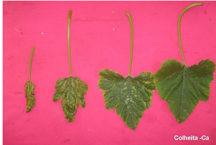
Figura 8. Evolução dos sintomas nas folhas dos tratamentos sob omissão de Cálcio na colheita. Lavras – MG.