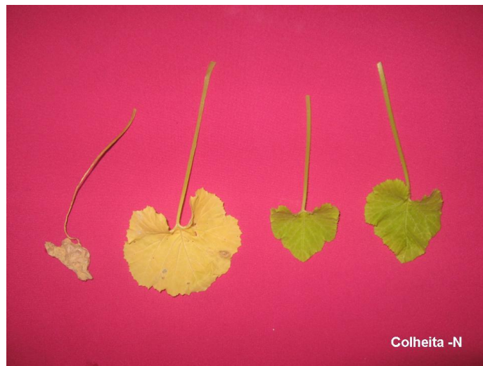
Figura 2. Evolução dos sintomas nas folhas dos tratamentos sob omissão de Nitrogênio na colheita. Lavras – MG.