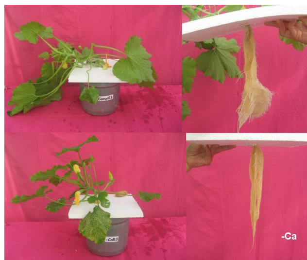
Figura 7. Comparação da parte aérea e raiz das plantas sob omissão de Cálcio (abaixo) e tratamento completo (acima). Lavras – MG.

As plantas sob omissão de Ca começaram a apresentar sintomas a partir do sétimo dia. Inicialmente as plantas apresentaram crescimento lento. Os sintomas visuais de deficiência de Ca foram caracterizados por uma clorose das margens das folhas mais jovens. Com o avanço da deficiência, a clorose progrediu para manchas necróticas (Figuras 7 e 8). As raízes das plantas apresentaram necroses dos ápices e coloração marrom. Resultados semelhantes foram observados por Frazão, (2008) em bastão-do-imperador e Almeida, (2007) em copo-de-leite.