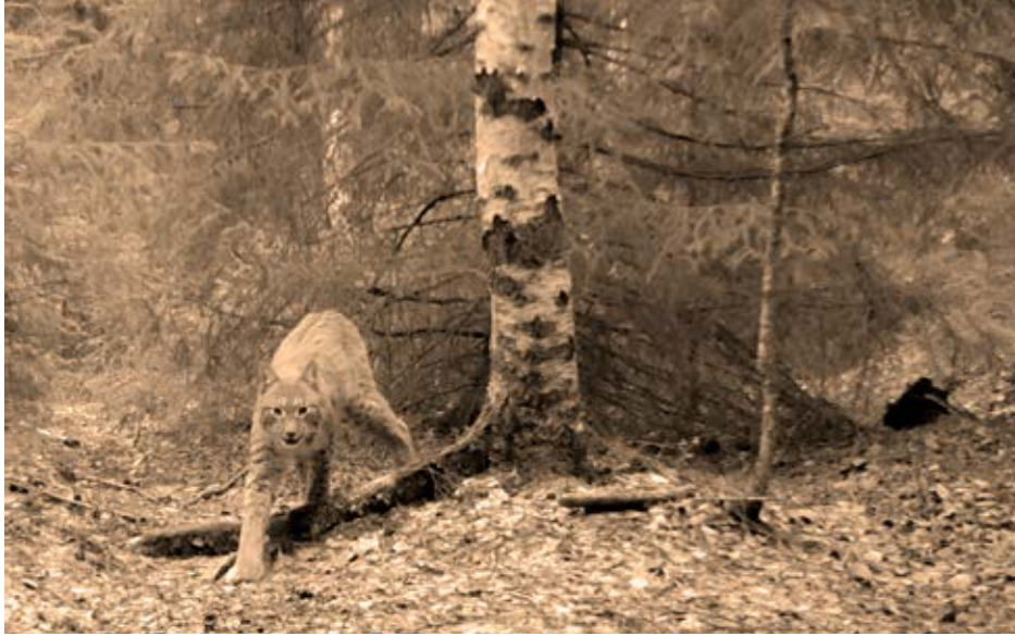
Kuva 2. Valtaurus "Partajooseppi".

uudelleen arviointi on tarpeen. Hannun kuvat nostavat esiin ilveksen metsästykseen liittyvät eettiset ja ekologiset ongelmat (Suomen luonnonsuojeluliitto, 2019) sekä laajemman tulevaisuuden haasteen, jonka ihmiskunta on kohtaamassa antroposeenin aikakaudella (Crutzen & Stoermer, 2000). Luonnon resurssien hupertessa, ilmaston muuttuessa ja lajien kuollessa sukupuuttoon syntyy tarve etsiä uusia merkityksiä ihmiskunnan kohtalon kysymyksenä, jotta kyetään sopeutumaan muuttuviin olosuhteisiin.