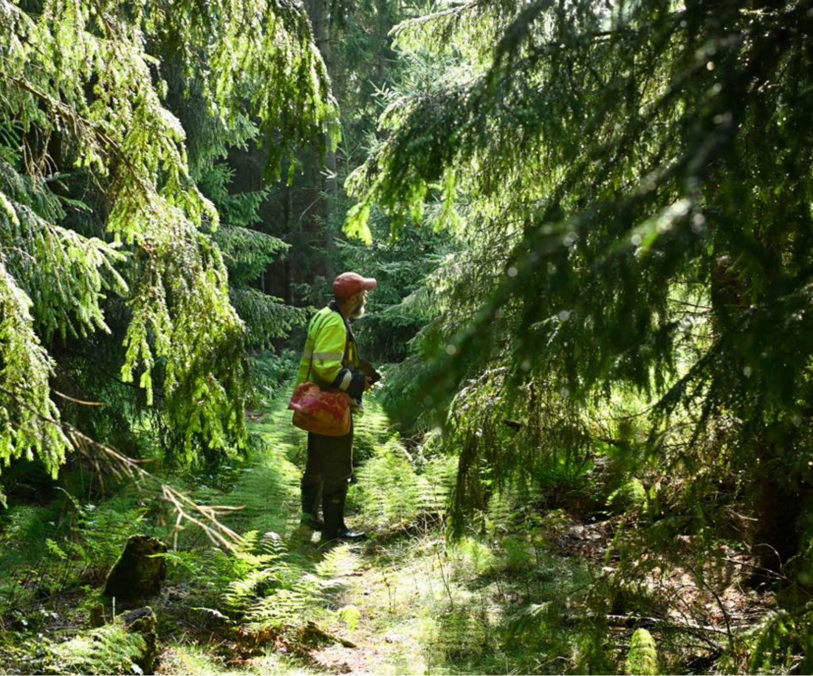
Kuva 1. Hannu ilvesmetsässä.