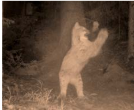
Kuva 5. Ilveksen pentu leikkii.

Täplikäs emo lähestyy tarkkaavaisesti kameraa, nuuhkaisee sitä ja jatkaa eteenpäin. Kolme nuorta pentua seuraavat emon mallia. Nekin tutustuvat kameroiden erikoiseen muotoon ja tuoksuun, jonka jälkeen leikki voi alkaa – Hannun tuomalla kukonsulalla. (Kuva 5)