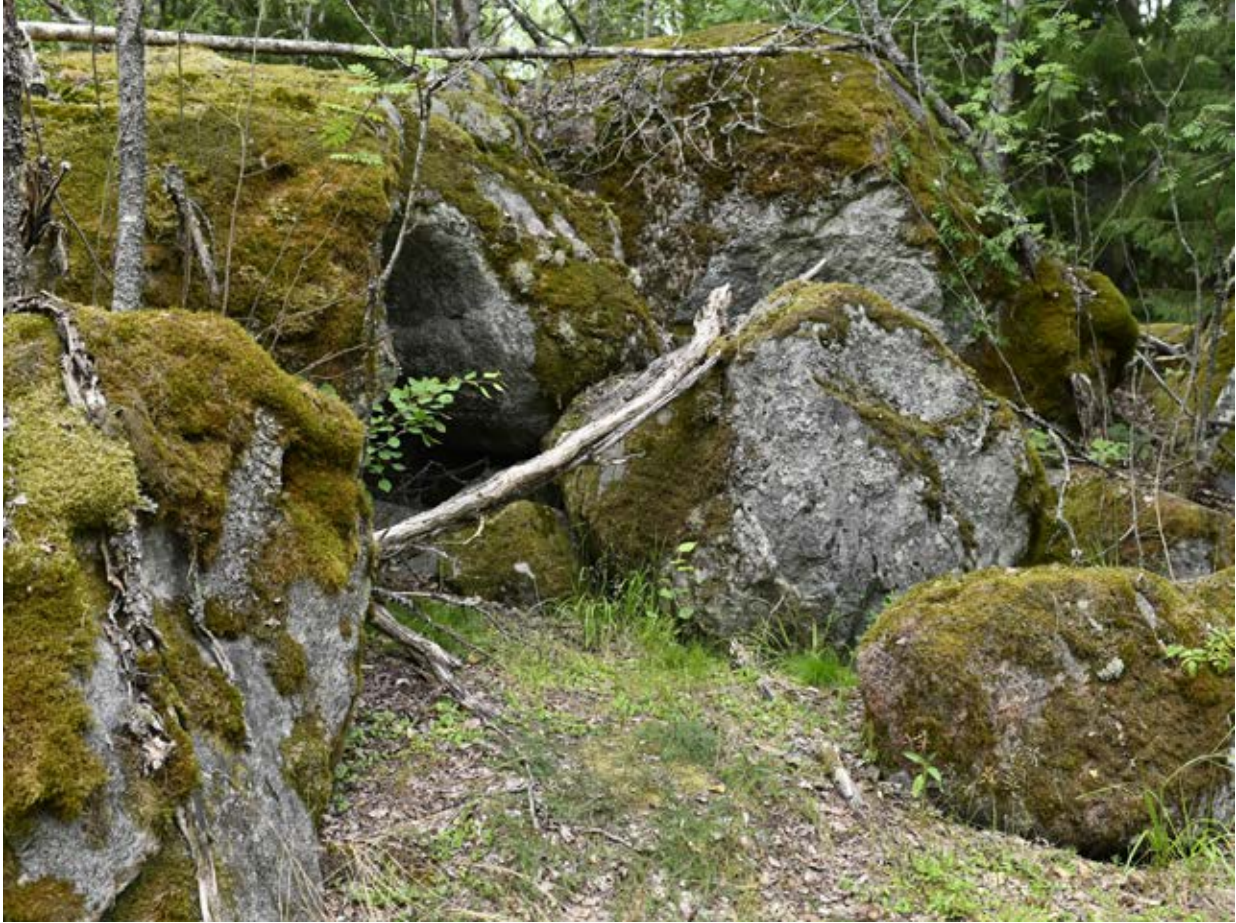
Kuva 4. Ilveskallio.

neeksi uuden visuaalisen kielen käyttöä, joka purkaa aiempaa ja luo sattumien avulla uusia merkityksiä, joiden ymmärtäminen vaatii uudelleenmäärittelyä ja neuvotteluja aiempaan nähden. Kuvien ja videoiden välityksellä tapahtuva ilveksen katseen kohtaaminen asettaa ihmisen uuteen rooliin: yhtäältä ilveksen katselijaksi toisaalta ilveksen katseen kohtaamaksi, jossa ihminen voi oivaltaa myös oman paikkansa luonnon kestävässä kiertokulussa.