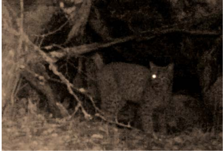
Kuva 3. Kuvakaappaus Hannun videosta. Kuva: Hannu Rantala, 2018.

Metsäautotielle asetettu riistakamera tallentaa ilvesten ja muiden eläinten rinnalla kaikki muutkin tiellä liikkujat kuten lintumiehet, marjastajat, sienestäjät, metsästäjät, maastoautoilijat ja -pyöräilijät. Ihmisen poistuessa häiritsemästä samaa tietä käyttävät myyrät, hiiret, näädat, supit, ketut, lehtokurpat, saukot, kurjet ja rastaat. Kuvien myötä katsoja ei voi olla ihastelematta luonnon monimuotoisuutta, joka näyttäytyy rikkaudessaan niinä hetkinä, kun ihminen ei ole paikalla. Kuvat synnyttävät katsojassa emotionaalista kokemusta, jonka perusteella ihminen ja eläimet näyttävät kuvissa elävän eräänlaisessa sopusoinnussa. Toisin sanoen kuva-aineisto havainnollistaa, että ihminen ja eläimet elävät vuorottain samassa tilassa, jota eläimet käyttävät silloin, kun ihminen ei sitä tarvitse. Kuvien perusteella ihminen ja peto voivat jakaa luonnon kestäväällä tavalla. Yöaikaan liikkuva ilves näyttäytyy harmittomana liikkujana, ja tulee tutummaksi ja ymmärrettävämmäksi.