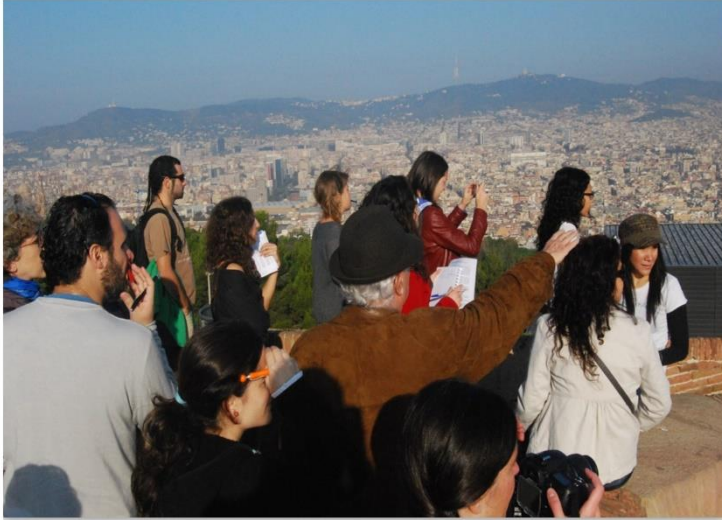
Figura 3: Vista desde el Castell de Monjuic, 6 Nov. 2010