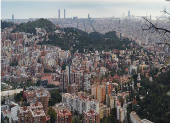
Figura 1: Vista de la ciutat de Barcelona desde el Mirador de la Rabassada