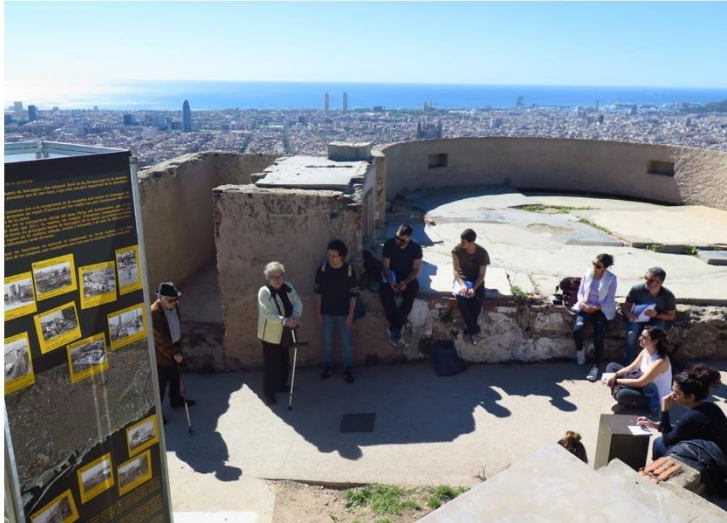
Figura 5: Visita al Turó de la Rovira, 6 Mayo 2017