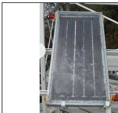
Figura 1: Sistema utilizando placa absorbadora de Hidrobronz de sección ¾”

La transferencia se centró en la construcción de dos sistemas para calentamiento de agua solar de 2m 2 c/u de superficie de colección a través de parrillas de: policloruro de vinilo (PVC) de sección 2” y de Hidrobronz (HB) de sección ¾”. Ambas cajas fueron realizadas en chapa galvanizada N° 24, aislación térmica de 2cm de poliestireno expandido de alta densidad (20kg/m 3 ), forrada en papel de aluminio y cerrada con policarbonato de 5mm. Para el tanque acumulador se utilizaron recipientes plásticos de 80lt, los cuales fueron aislados con 5cm de lana de vidrio y envueltos en otro tanque de mayor sección. Para las conexiones se utilizaron mangueras de ¾” y uniones de polipropileno, todas ellas recubiertas con aislación térmica para cañerías de 1cm, protegida con papel aluminio. (Figuras 1 y 2)