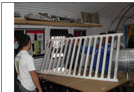
Figura 3. Construcción de la Parrilla de PVC