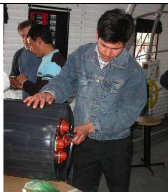
Figura 6. Entradas y salidas del Tanque de Acumulación