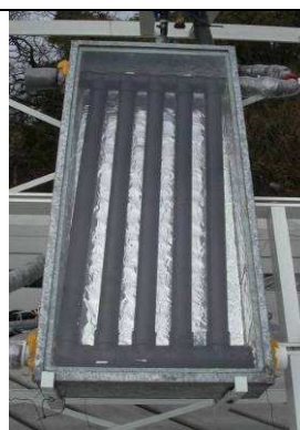
Figura 2: Sistema utilizando placa absorbadora de Caños de PVC de 50mm.