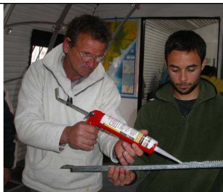
Figura 7. Sellado del policarbonato de la caja.