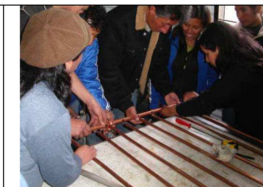
Figura 4. Parrilla de Hidrobronz