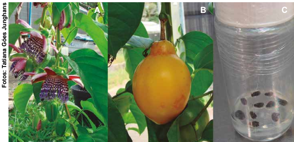
Figura 1. Passiflora alata , acesso BGP220: flores e botões florais (A); fruto maduro (B); e sementes acondicionadas em meio de cultivo in vitro para o armazenamento (C).