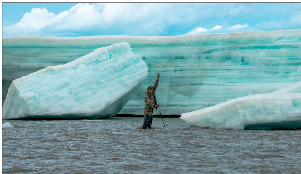
Рис. 1. Крупнейшая в мире наледь Улахан-Тарын (долина р. Момы, Республика Саха (Якутия)).

Чуйско-Курайское ледово-подпрудное озеро образовалось на границе неоплейстоцена и голоцена. В научных публикациях [1, 2] формирование плотины постулировалось как образование за счет подпруживания ледниками, спускавшимися в Курайскую котловину навстречу друг другу с противоположных хребтов — Северо-Чуйского и Курайского (по долинам р. Маашей с Айгулакского хребта, по долинам рек Бельгибаш, Бока, Ештыкольского плато). Утверждается [1, 2], что в районе массива Белькенёк (в зоне предполагаемой аккумуляции ледников) ледниковая плотина имела наибольшую высоту — 800 м (абс. выс. 2200 м). Площадь ледникового покрова, перекрывавшего сток р. Чуи, превышала 200 км 2 ; в поперечном сечении с запада на восток, начиная от массива Белкенёк, его протяженность составляла 15 км (рис. 1). Характеризуя современные представления о строении Чуйско-Курайской ледово-подпрудной плотины, авторы в своих исследованиях утверждают, что подпруживавшие русла рек ледники характеризовались «...интенсивным блоковым дроблением льда, трещиноватостью, что обеспечивало нахождение тальми водами достаточных каналов стока... Наиболее вероятно, частичный сброс воды Чуйско-Курайского озера происходил через подледниковые и внутриледниковые каналы» [1, с. 4, 7]. Данные утверждения характеризуют устойчивость плотины как недостаточную