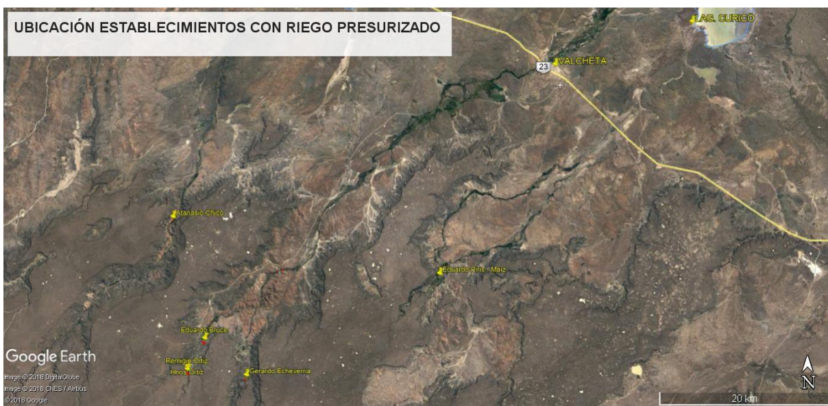
Figura N° 2: Ubicación relativa de las experiencias de riego respecto de la localidad de Valcheta.