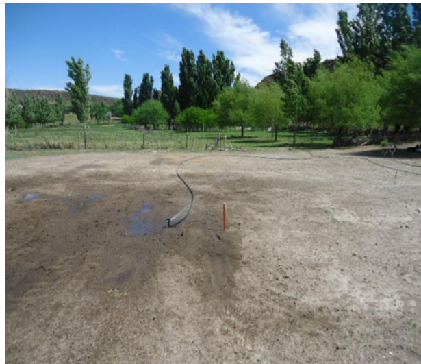
Foto 10: Primer experiencia de Riego presurizado en Establecimiento El Bagual de Hnos. Ortíz.