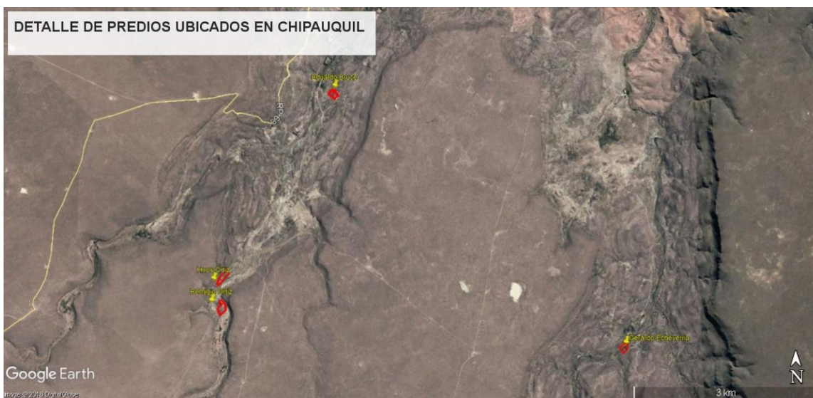
Figura N° 3: Ubicación de las 4 chacras en dos de los brazos del Arroyo Valcheta en Chipauquil