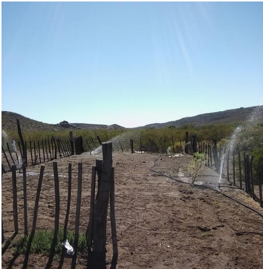
Foto 9: Riego por aspersion en campo de Arroyo Salado, propiedad de Atanasio Chico.