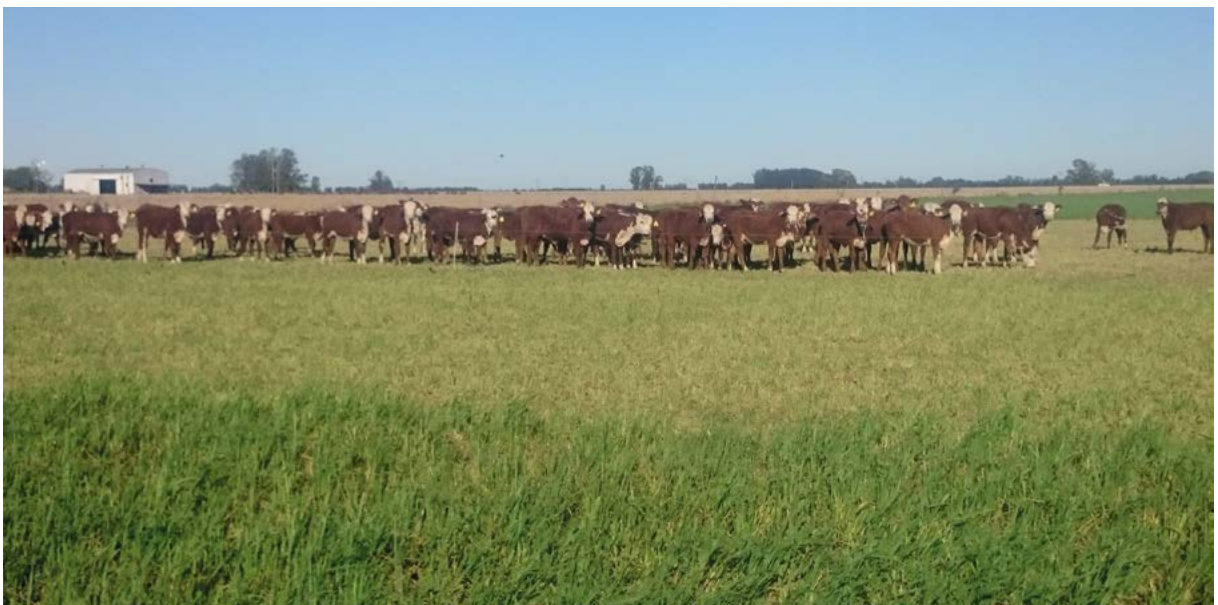
Cuadro 2. Rendimiento (kg MS/ha) y Tasa de producción de 10 avenas comerciales y pre-comerciales bajo diferentes números de corte. Segunda fecha de siembra.

Medias con una letra común no son significativamente diferentes ( p > 0,05 ). Letras mayúsculas (columna) efecto de los materiales. Letras minúsculas (fila) efecto del número de corte.