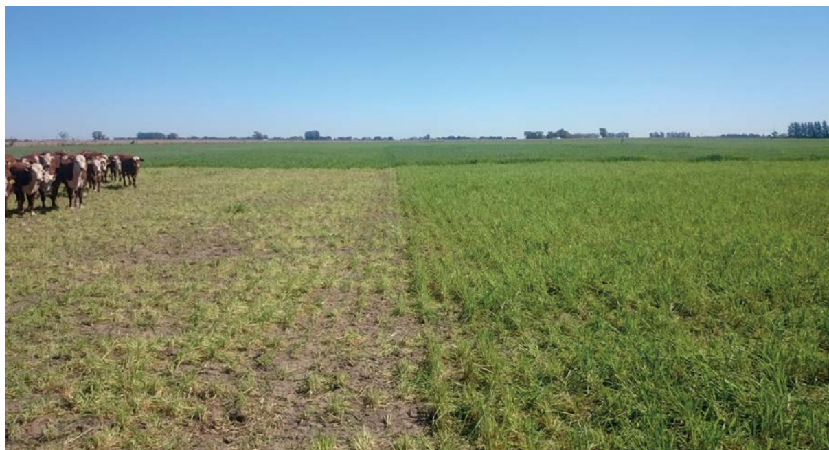
Cuadro 4. Producción de MS y factor de uso de los verdeos evaluados, en dos momentos de pastoreo y total.