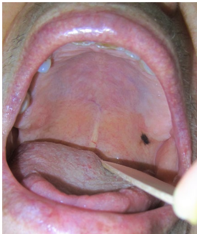
Figura 2 - Mancha negra na mucosa oral, induzida pela minociclina.