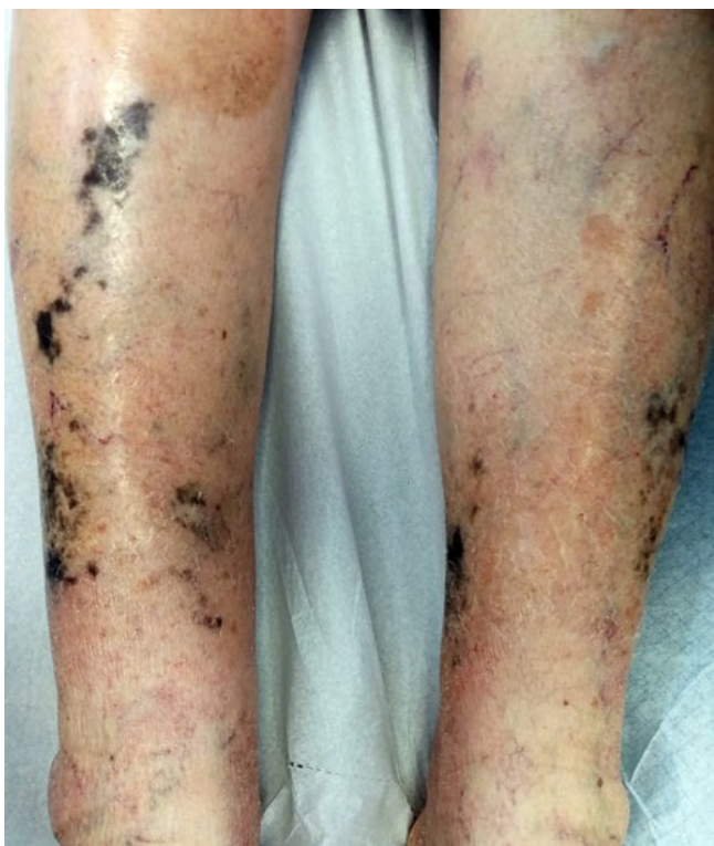
Figura 1 - Manchas negras dispersas pelas pernas, induzidas pela minociclina.