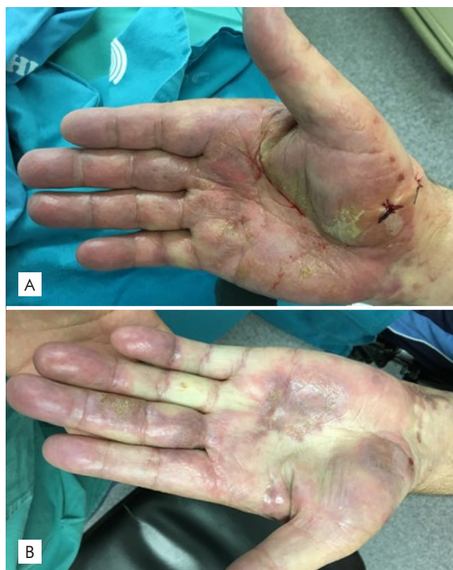
Figura 1 - Lesões vesiculobolhosas com base eritematosa associadas a erosões a nível palmar bilateral.

Foi enviada amostra para cultura de fungos que foi negativa. O estudo histopatológico de biópsia cutânea mostrou descolamento bolhoso subepidérmico com extensa reepitelização subjacente associado a infiltrado linfomononucleado perivascular rico em eosinófilos (Fig. 2). A imunofluorescência direta (IFD) de área perilesional mostrou depósitos lineares de C3 e IgG ao nível da junção dermo-epidérmica. Foram detectados anticorpos circulantes para BP180 (122 U/mL, normal >20 U/mL) por ELISA. Foi iniciado tratamento com prednisolona 30 mg/dia em desmame durante 2 semanas associado a dermatocorticóide de alta potência com resolução das lesões e sem formação de novas bolhas em dois anos de follow-up .