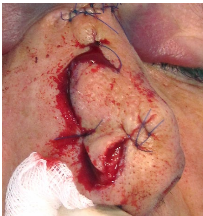
Figura 8 - Passo intermédio na realização do retalho de rotação para reconstrução do defeito da ponta nasal.