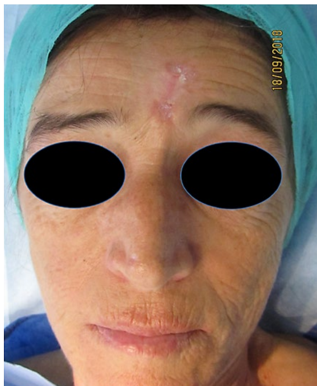
Figura 1 - Lesão envolvendo a glabella e fronte.