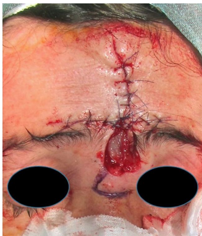
Figura 6 - Defeito remanescente após realização do retalho de avanço A-T. Desenho do retalho de transposição romboidal a realizar para encerramento do defeito da glabella.