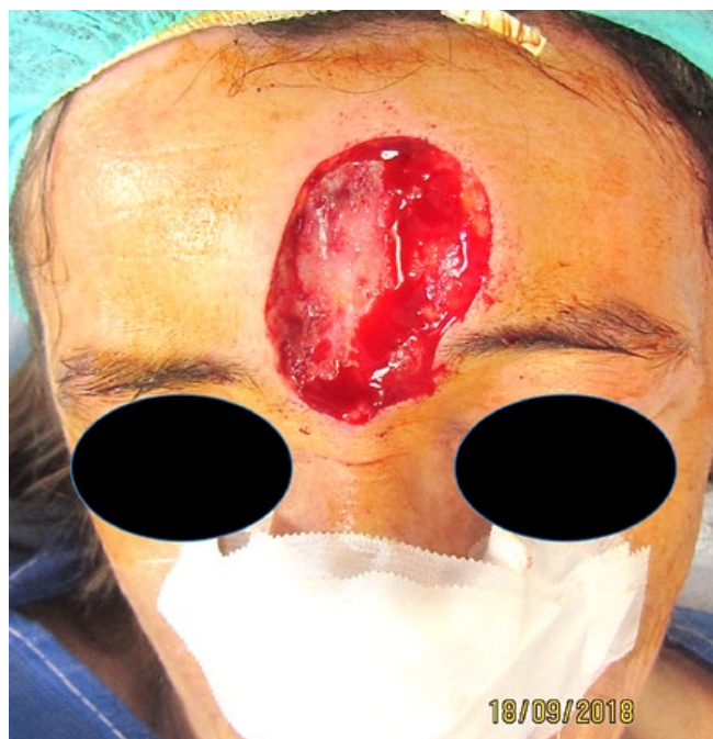
Figura 4 - Defeito cirúrgico da glabella e fronte.