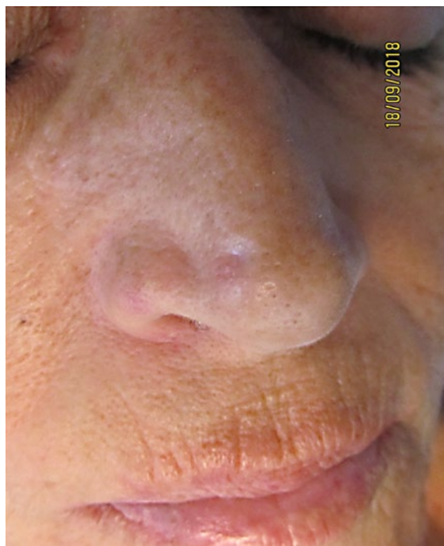
Figura 2 - Pápula deprimida na ponta nasal correspondendo a CBC.

eritematosa de centro deprimido com aspeto cicatricial, limites mal definidos, bordo bosselado e áreas erodionadas. A lesão media 1,9 x 3,4 cm de diâmetro e localizava-se na glabella e área contígua da fronte (Fig. 1).