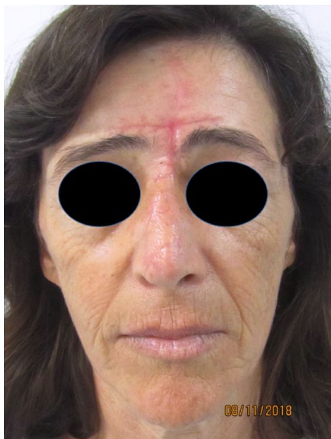
Figura 10 - Resultado às 7 semanas do pós-operatório.