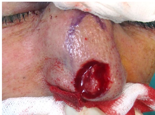
Figura 7 - Defeito cirúrgico da ponta nasal.

região inferior do defeito optou-se por um retalho de transposição romboidal, de forma a evitar a união dos supracílios e, simultaneamente, tensão sobre o canto interno do olho (Fig. 6).