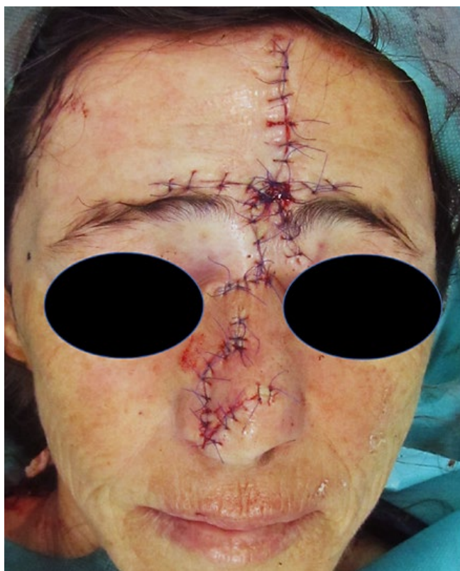
Figura 9 - Pós-operatório imediato. Reconstrução do defeito da glabella e frente e do defeito pós exérese de CBC da ponta nasal com retalho de rotação.