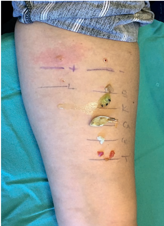
Figura 1 - Exemplicação dos testes cutâneos por picada (TCp) pelo método prick-to-prick e de contacto.