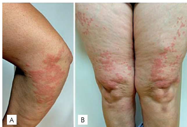
Figura 2 - Erupção polimorfa à luz localizada com lesões limitadas aos cotovelos e joelhos. (cortesia Dra. Joana Cabete, Centro Hospitalar Lisboa Central).

estimulando a reparação do DNA imediatamente após ou durante a exposição solar o que diminuiu os sintomas de EPL após fotoprovação. 62,63 De facto, a reparação imediata do DNA lesado pela radiação UV remove precocemente o estímulo antigénico indutor de EPL, contribuindo desta forma para uma redução dos sintomas. 3 O afamelanotide é um análogo da \alpha -melanocyte-stimulating hormone ( \alpha -MSH) que estimula melanogénese. 64 Está aprovado pela FDA sob a forma de implante subcutâneo 16 mg para protoporfiria eritropoiética e decorrem actualmente estudos de fase II e III para fotodermatoses como a EPL. 64 Os potenciais riscos a longo-prazo nomeadamente de desenvolvimento de nevos displásicos ou melanoma devem ser tidos em conta na monitorização dos doentes tratados.