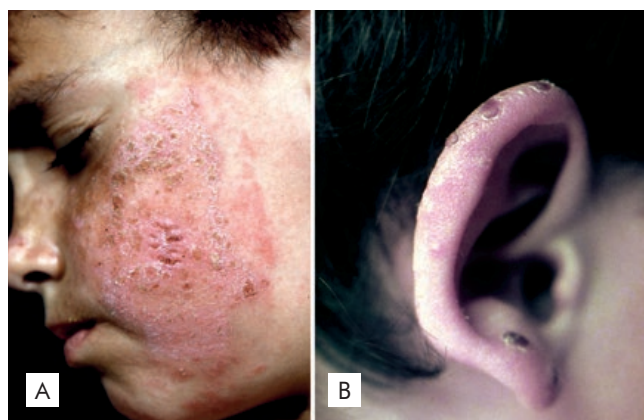
Figura 5 - (A) Placas eritematosas, liquenificadas com crostas hemorrágicas aderentes confluentes na região malar de uma criança de 7 anos de idade com o diagnóstico de Hydroa Vacciniforme. (B) Lesões de Hydroa Vacciniforme localizadas nas hélices pavilhões auriculares.

Em doentes com contra-indicação ou refractários à talidomida pode ser administrada CsA (2,5 mg/kg/dia 6-8 meses) ou azatioprina (50-100 mg/dia 8 meses) com taxas variáveis de sucesso. 18