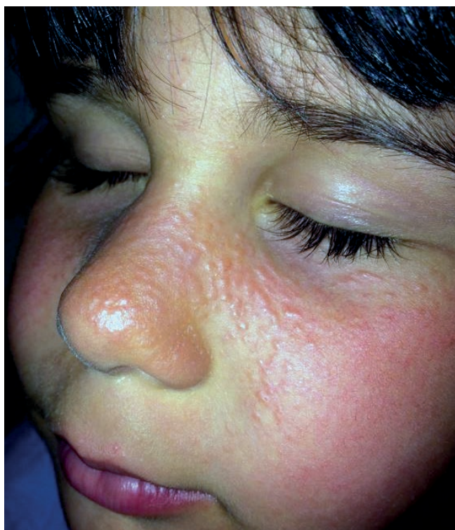
Figura 3 - Erupção polimorfa à luz juvenil. (cortesia Dra. Joana Cabete, Centro Hospitalar Lisboa Central).