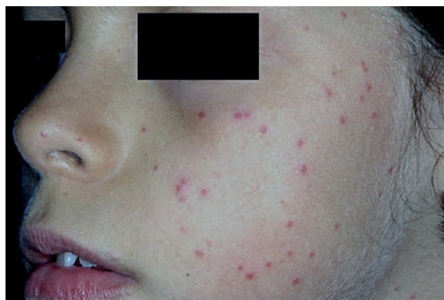
Figura 4 - Prurigo actínico em doente do sexo masculino com 8 anos idade.

Corticoides, inibidores tópicos da calcineurina (ITC) e emolientes poderão produzir algum alívio sintomático em doentes com manifestações ligeiras. A aplicação de CsA tópica a 2% está indicada no envolvimento ocular (2 a 3 gotas/dia 3 meses). 68 Em casos moderados a graves, ciclos curtos de corticóides orais (0,5-1 mg/kg/dia) diminuem a sintomatologia dos episódios agudos, mas não induzem a remissão completa das lesões. 69