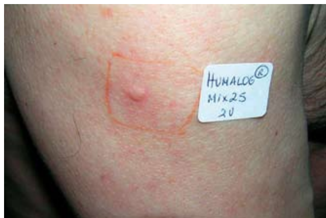
Fig. 2 - Teste de provocação com 2U de Humalog® Mix 25 no braço direito, com desenvolvimento de pápula eritematosa com 7mm de diâmetro aos 20 minutos após injeccção.

capilares entre 70 e 160mg/dl), sem necessidade de alteração da dose total diária com a progressão da dermatose. A suspeita inicial de reacção adversa ao metal das agulhas subcutâneas de administração já tinha justificado a alteração das mesmas, não tendo induzido qualquer melhoria.