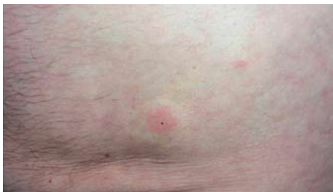
Fig. 1 - Lesão urticariforme abdominal em local de prévia administração de insulina Humalog® Mix 25. Superiormente, à esquerda, observa-se uma pequena lesão semelhante de evolução sincrónica não relacionada directamente com a injeccção.