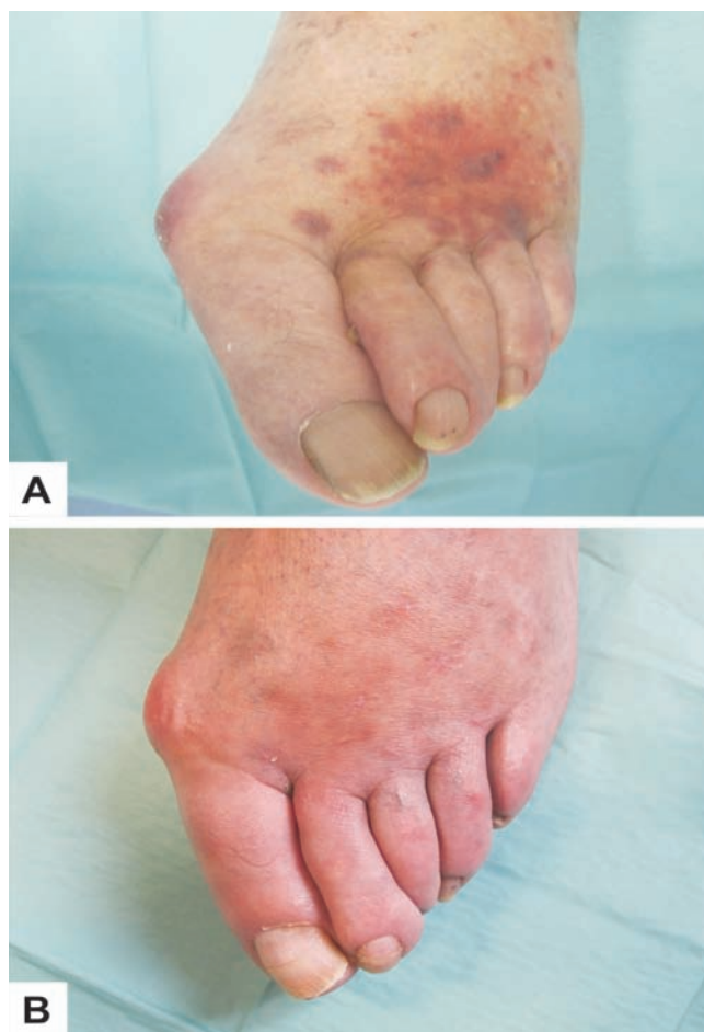
Fig. 1 - (A) Pápulas e nódulos eritematosos no dorso do pé esquerdo; (B) Resolução completa das lesões após tratamento com voriconazol.

Um doente de 71 anos, caucasiano, trabalhador rural, foi referenciado à consulta de Dermatologia por pápulas e nódulos eritematosos e dolorosos no dorso do pé esquerdo acompanhado de ligeiro edema local,