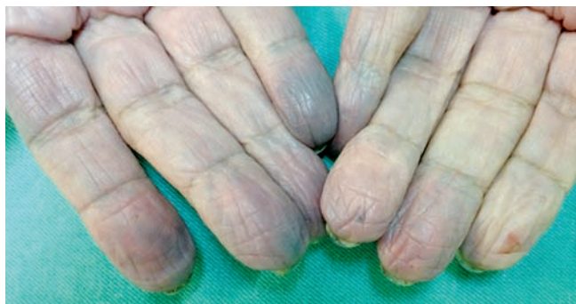
Fig 2 - Lesões equimóticas nas polpas digitais dos quirodáctilos e presença de múltiplas lesões perfurantes provocadas para realização da glicemia capilar.

Assim, concluímos tratar-se de cianose mista, associada a petéquias e equimoses. A evolução foi boa, havendo desaparecimento das lesões após a melhora clínica e a interrupção da realização de múltiplas puncturas.