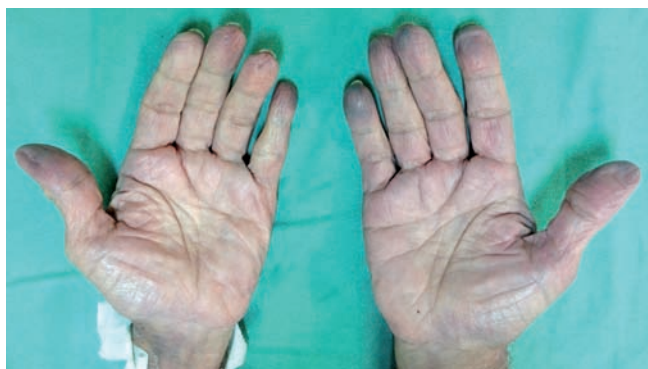
Fig 1 - Aspecto cianótico das falanges distais dos quirodáctilos.

das mãos (Fig.s 2 e 3). Apesar da dieta apropriada e uso da insulina suplementar para controle da hiperglicemia, foi difícil obter o controle glicêmico do paciente. Em virtude da necessidade do rígido controle da glicemia, foram realizadas avaliações da glicemia capilar a cada 3 horas e os múltiplos ferimentos provocados pela lanceta nas polpas digitais resultaram em equimoses e petéquias das falanges distais, simulando um quadro de isquemia periférica. Tais traumatismos múltiplos ainda resultaram em lesão endotelial, aumento da permeabilidade capilar com prejuízo na microcirculação resultando em cianose periférica e simulação de quadro de isquemia periférica. Além disso, o quadro de pneumonia extensa favoreceu o surgimento de uma cianose central por distúrbio na difusão e ventilação pulmonar.