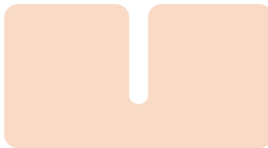
Fig 1 - Cicatriz ice-pick . 20

As cicatrizes em furador de gelo ( ice-pick ) são depressões cilíndricas verticais profundas e estreitas situadas na região do infundíbulo. Em vista de sua profundidade, essas lesões são mais resistentes no tratamento. Pacientes com cicatrizes em ice-pick podem obter uma melhora significativa através da aplicação de TCA (ácido tricloroacético) a 65% - 100%, peeling profundo, sobre cicatrizes individuais, chamada de técnica de CROSS – reconstrução química de cicatrizes cutâneas. O resurfacing fracionário também é uma ótima opção para esse tipo de cicatriz, mas normalmente mais de um tratamento é necessário com essa técnica. E a melhora das cicatrizes se desenvolve ao longo de vários meses após o final dos tratamentos com laser, uma melhora gradual ao longo do tempo. Sendo que o padrão-ouro para a ice-pick são as técnicas de excisão 2,4,17-19 .