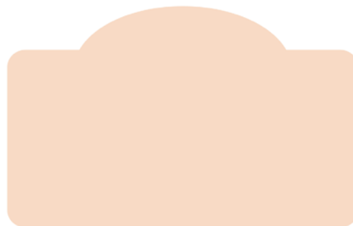
Fig 4 - Cicatriz hipertrófica ou quelóide. 20

As quelóides formam pápulas e nódulos vermelho-púrpuras que proliferam além das fronteiras da ferida