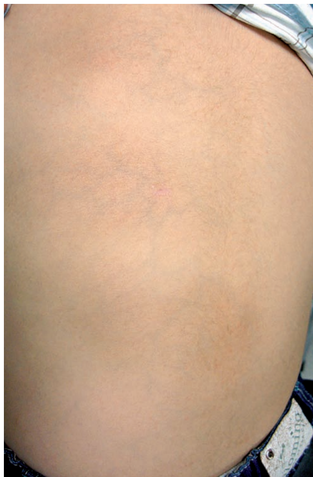
Fig 1 - Manchas castanhas discretamente hiperpigmentadas, de contornos irregulares, hipertricose, com mais de 20cm de maior eixo cada, na área toracolombar esquerda.

Foi realizada biopsia cutânea que mostrou epiderme sem alterações e hiperplasia das glândulas sudoríparas écrinas, aumento do número de capilares, com