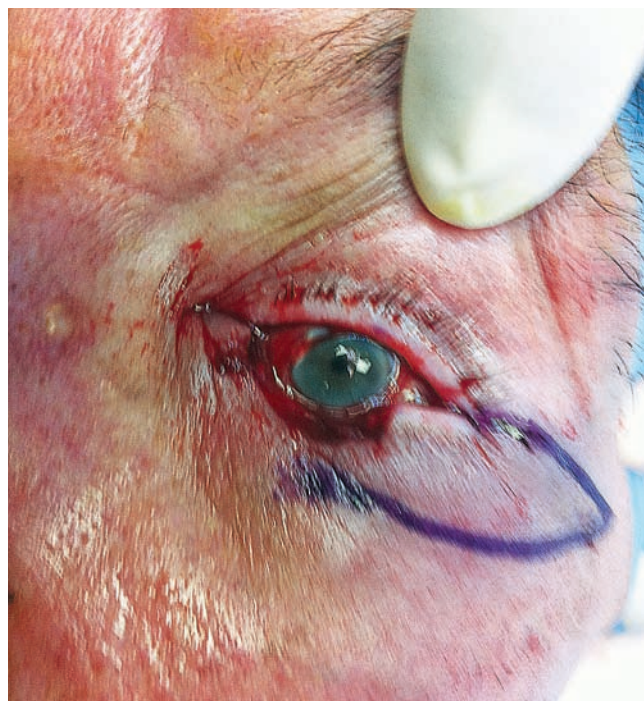
Fig 2 - Defeito cirúrgico envolvendo o terço médio da pálpebra inferior. Desenho do retalho planeado (avanço V-Y com cantotomia externa).

retalho de avanço horizontal V-Y combinado com uma cantotomia externa, o que permitiu a sutura das duas porções da pálpebra restantes. Intraoperatoriamente, concluiu-se que esta solução implicaria a perda de rigidez pela pálpebra inferior, com o compromisso funcional consequente. Decidiu-se assim reforçar o retalho cutâneo reconstruindo a lamela posterior da pálpebra. Colheu-se um enxerto condro-mucoso no septo nasal, o qual foi modelado em forma de meia-lua. Adicionalmente, fizeram-se incisões verticais na sua face condral permitindo ao mesmo dobrar ligeiramente e adquirir a convexidade necessária para se adaptar ao globo ocular. O enxerto foi então colocado entre o retalho V-Y previamente referido e a conjuntiva