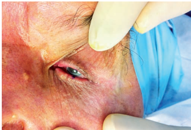
Fig 1 - Carcinoma basocelular ocupando o terço médio da pálpebra inferior esquerda.

Reporta-se o caso clínico de um doente de 85 anos com o diagnóstico de um carcinoma basocelular, envolvendo o terço interno da pálpebra inferior esquerda (Fig. 1). A excisão deste tumor, com margens cirúrgicas apropriadas, resultou num defeito envolvendo toda a espessura de aproximadamente metade da pálpebra inferior, sendo possível manter o seu terço externo e poupar o ponto lacrimal. De acordo com o que tinha sido planeado (Fig. 2), executou-se um