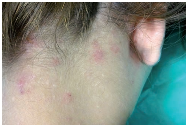
Fig 1 - Lesões eritematosas e exulceradas na região cervical posterior.

Paciente do sexo feminino, 28 anos, em uso de anovulatório, apresentava pápulas pouco pruriginosas no cotovelo e na região cervical posterior há sete meses, sem melhora com uso de cremes e anti-histamínicos. Nos últimos três meses, houve piora do quadro, com aumento do prurido e disseminação das lesões, mensalmente no período menstrual, coincidindo com a suspensão do contraceptivo oral. Ao exame dermatológico,