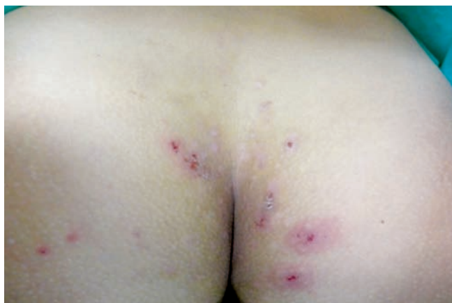
Fig 2 - Lesões exulcero crostosas sob base eritematosa nas regiões sacrococcígea e glútea.