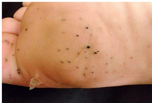
Fig 3 - Espículas pretas na região plantar do pé esquerdo.

de ambos os pés e falanges distais do segundo e quarto quirodáctilos direitos (Fig.s 2 e 3). Uma inspeção cuidadosa descartou a presença de lesões de tungíase, as quais podem ser um simulador clínico do quadro e comumente são adquiridas em locais arenosos. Foram realizadas radiografias de ambos os pés e da mão direita que demonstraram a variação da profundidade e múltiplos ângulos de entrada das espículas (Fig. 4). Foram realizadas assepsia e antissepsia local, anestesia da área em que havia espículas e extração manual das espículas com auxílio de agulha e pinça.