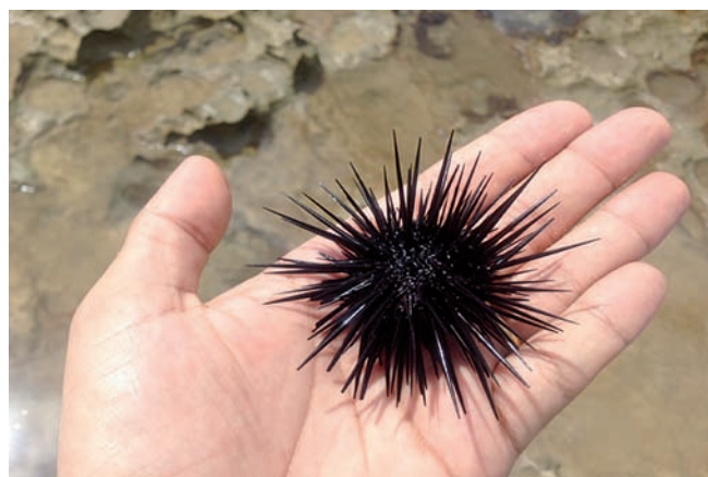
Fig. 1 - Ouriço-do-mar preto ( Echinometra lucunter ).

Os autores apresentam o caso de um paciente de 17 anos atendido no serviço de emergência com quadro de dor intensa provocada devido a acidente com um ouriço-do-mar. O paciente relatava que estava sobre uma pedra na encosta da Praia Vermelha na Urca, Rio de Janeiro, quando foi derrubado no mar por uma forte onda. Ao cair na água, teve múltiplos traumatismos nos pés e na mão direita provocados por ouriços-do-mar preto. Em virtude da intensa dor, apresentou dificuldade para nadar e teve que ser resgatado pelo corpo de bombeiros. À admissão hospitalar: PA 110x70mmHg, frequência cardíaca 78 bpm, avaliações cardiorrespiratória e neurológica normais. Ao exame dermatológico, foram observados múltiplos pontos pretos correspondentes a espículas de ouriço-do-mar na região plantar