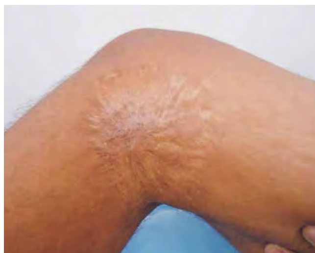
Fig 3 - Cicatriz cribiforme na face medial do joelho direito.