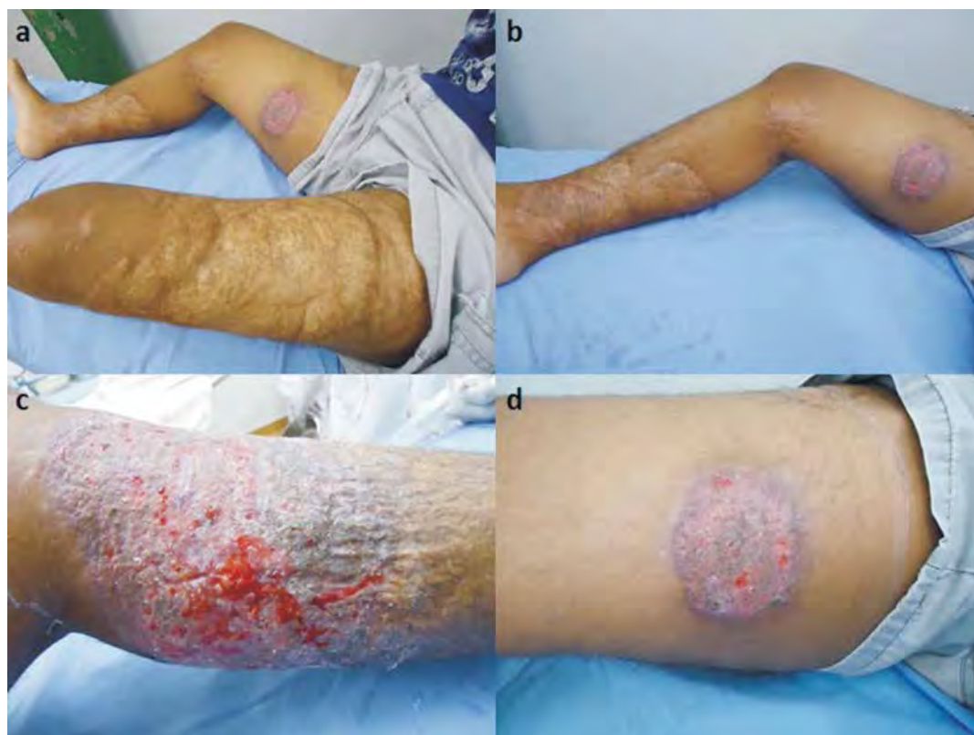
Fig. 2 - (a-d) Cicatrizes e lesões úlcero vegetantes extensas nos membros inferiores.