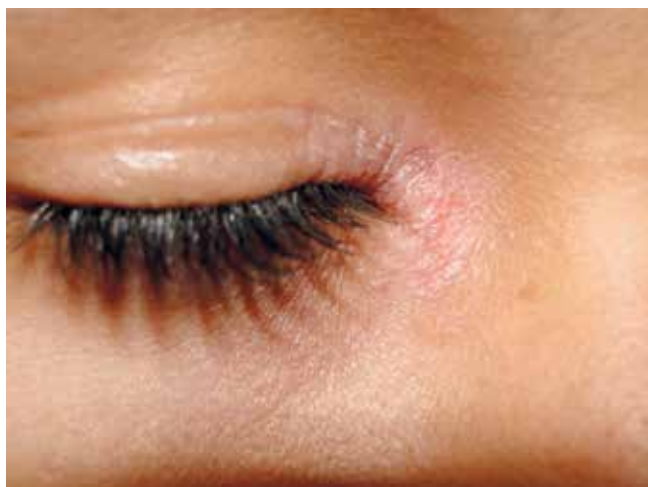
Fig 1 - Descamação e eritema em pálpebra superior direita.