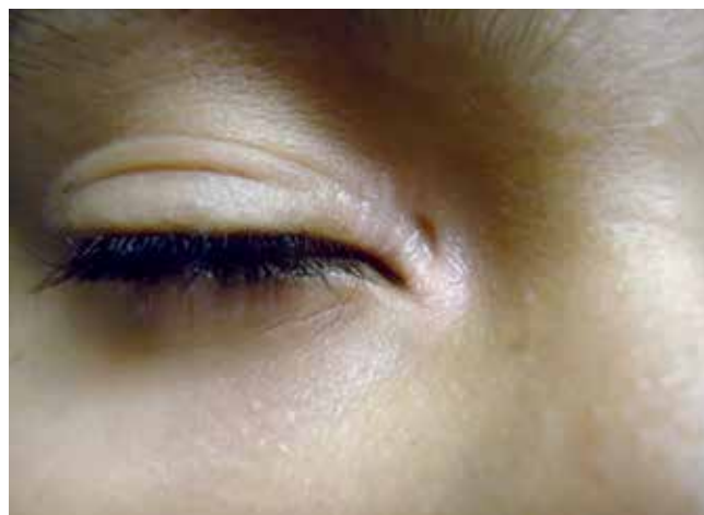
Fig 3 - Em reavaliação, cinco semanas após, ausência de blefarite.

oftalmologista e a avaliação oftalmológica não revelou comprometimento globo ocular. Em reavaliação, cinco semanas após, o paciente não apresentava mais blefarite (Fig. 3), entretanto segue em acompanhamento semestral com orientação de avaliação oftalmológica periódica.