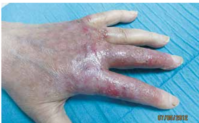
Fig 3 - Aspeto clínico das lesões após um mês de terapêutica com corticoides sistémicos e Dapsona (caso clínico 1).

artrópode, introdução recente de fármacos ou aplicação prévia de tópicos. Negava ainda, para além de queixas alérgicas locais, queixas sistémicas, nomeadamente febre. Da avaliação analítica complementar era de destacar presença de leucocitose ( 12.7 \times 10^9/L ) com neutrofilia (79%) e PCR 3.5mg/dL. A doente encontrava-se internada na enfermaria de Cirurgia Plástica onde já tinha sido submetida a antibioterapia de largo espetro e desbridamento cirúrgico com posterior enxerto cutâneo das lesões do 3º dedo, com cicatrização das mesmas (ausência de patergia). Dada a ausência de melhoria foi referenciada à consulta de Dermatologia onde foi efetuada uma biopsia cutânea das lesões cujo exame histopatológico revelou presença de infiltrado inflamatório denso, constituído por neutrófilos, ocupando a derme papilar e reticular, com presença de pústula intraepidérmica e leucocitoclasia (Fig. 2). Não se observavam aspetos de vasculite. As colorações especiais para micro-organismos foram negativas. A doente foi medicada com Prednisolona oral (60mg/dia com diminuição progressiva da dose) associado a Dapsona (75mg/dia) com resolução praticamente completa das lesões no espaço de um mês (Fig. 3).