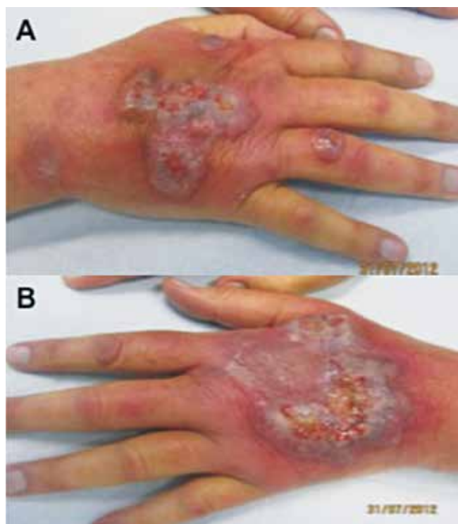
Fig. 4 - Aspecto clínico das lesões do caso clínico 2. A – mão direita. B – mão esquerda.

Observou-se ótima resposta clínica à corticoterapia oral (40mg/dia com esquema de diminuição progressiva da dose) com regressão da dermatose em 2 meses (Fig. 6).