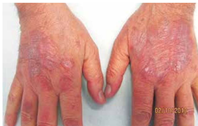
Fig. 6 - Aspecto clínico das lesões após dois meses de corticoterapia sistémica (caso clínico 2).