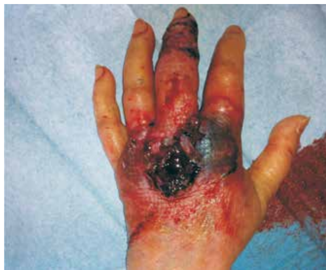
Fig. 1 - Aspeto clínico das lesões no dorso da mão esquerda (caso clínico 1).

Doente do sexo feminino, 68 anos, raça Caucasóide, com história pessoal de valvuloplastia mitral, medicada em ambulatório com Varfarina, referia, desde há quatro semanas, dermatose inicialmente localizada no dorso do 3º dedo da mão esquerda, com posterior extensão com carácter aditivo para o dorso da mesma, constituída por placa eritematoviolácea bem delimitada, com superfície ulcerada e preenchida por tecido necrótico, com nódulo de aspeto esponjoso, vesículas, pústulas e bolhas de conteúdo sero-hemático à periferia (Fig. 1). A doente negava traumatismo, picada de