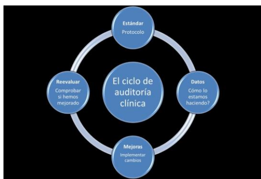
Figura 3. El ciclo de auditoría clínica

propuestas (formación, cambios en el protocolo...).