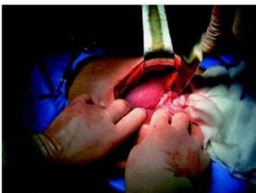
Fig 3. Se observa corazón, pulmón izquierdo colapsado y asas delgadas que se extraen de cavidad torácica izquierda.

El DCPT se asocia a síntomas neuropáticos en un 22% - 23% (4,5),