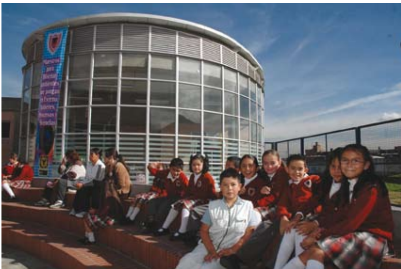
Normal Superior María Montessori, Localidad Rafael Uribe Uribe