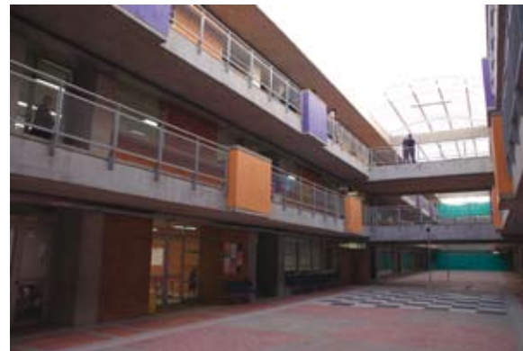
Colegio Débora Arango, Localidad de Bosa

Como resultado del plan de construcciones desarrollado entre el 2004 y 2008, la ciudad cuenta hoy con 30 colegios nuevos, 130 con reforzamiento, 43 ampliaciones y nuevas etapas, 250 mejoramientos y 854 obras menores; De igual manera se generaron 2.444 nuevas aulas de clase, 2.216 aulas de clase mejoradas y 420 aulas de clase especializadas y laboratorios.