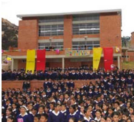
Colegio Ofelia Uribe de Acosta, Localidad de Usme

El programa de construcciones escolares le ha permitido a Bogotá crear en total 171.580 nuevos cupos: 119.540 mediante construcción de colegios nuevos, 24.960 por reforzamiento y mejoramiento de los colegios distritales antiguos y 23.080 por ampliación de los colegios. Como resultado del esfuerzo anterior, la matrícula oficial creció en un 17.4% entre el año 2003 y el 2007. En estas condiciones, la educación pública pasó de representar el 55.7% de la matrícula en 2003, al 62.5% en 2007.