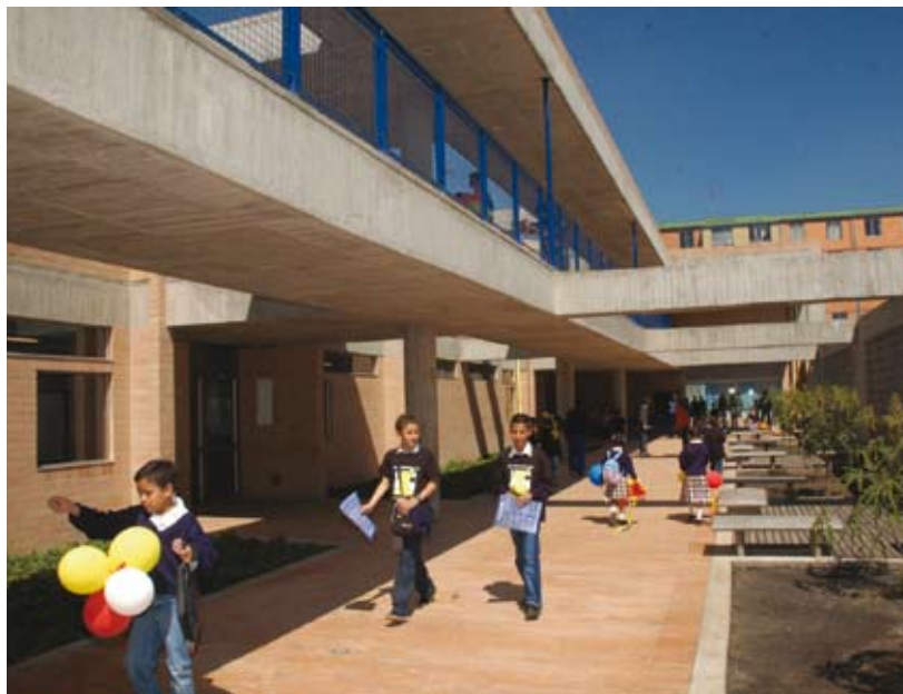
Colegio Gabriel Betancourt Mejía, Localidad de Kennedy

En el año 2005 la Secretaría de Educación estableció la gratuidad. Actualmente se benefician 607.262 con gratuidad total y 40.611 parcialmente. La gratuidad, la alimentación escolar, el transporte escolar, la entrega de útiles escolares, salud al colegio y la entrega de subsidios a la permanencia y de transporte tienen impacto positivo en los ingresos y en la calidad de vida de las familias. En el año 2012 toda la educación preescolar, básica y media será gratuita en la educación oficial.