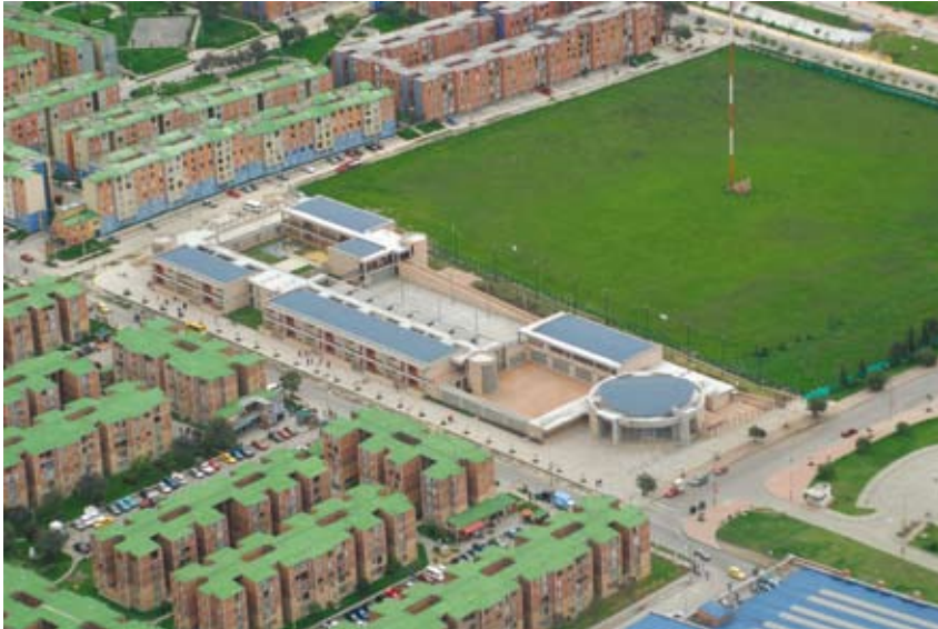
Colegio Gabriel Betancourt Mejía, Localidad de Kennedy

El derecho a la educación, la calidad de la educación y la creación de colegios públicos de excelencia constituyen los grandes objetivos del Plan Sectorial de Educación de Bogotá. El derecho a la educación sólo se cumplirá de manera integral cuando ésta sea de calidad para los niños y los jóvenes y logre afectar de manera positiva las condiciones de vida de los bogotanos. La calidad de la educación es un camino para luchar contra la pobreza, la inequidad, la injusticia y la exclusión social.