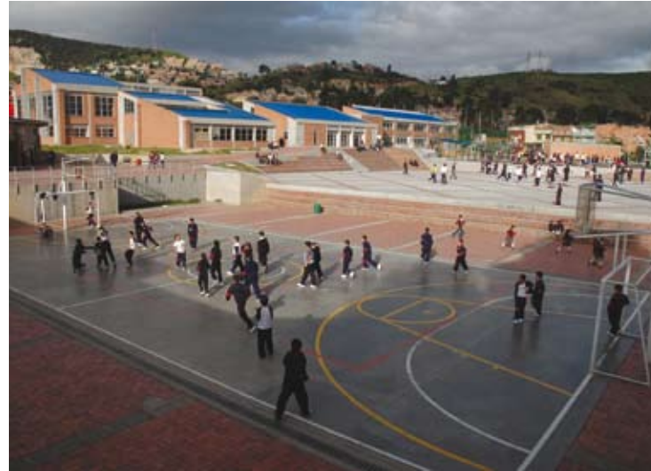
Colegio Enrique Olaya Herrera, Localidad Rafael Uribe Uribe

El colegio como escenario principal de la política educativa. El objetivo general y los objetivos específicos de la política educativa de Bogotá, se han de lograr en el escenario institucional de la educación, es decir, en los colegios. Para hacer viable el cumplimiento de la política educativa y de sus principios se requiere el compromiso de los directivos docentes, docentes, estudiantes y padre de familia en cada uno de los colegios oficiales de la ciudad.