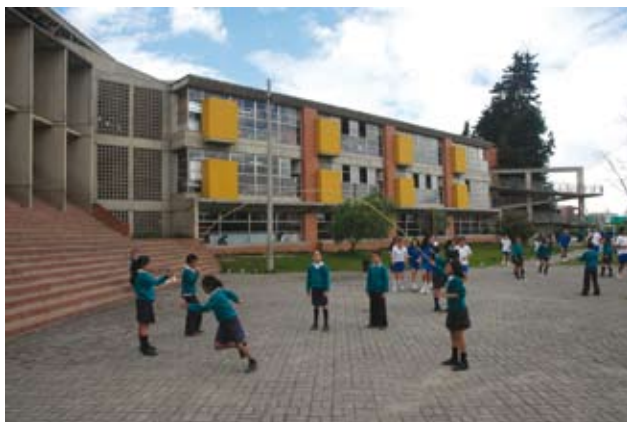
Colegio Leonardo Posada, Localidad de Bosa

Bogotá en el período 2004-2007 incrementó significativamente el gasto en educación. Más de 6.7 billones de pesos, el 23.1% del total de los recursos de inversión de la ciudad, se utilizaron para garantizar el derecho a la educación de los niños y jóvenes que asistieron a la Educación Básica y Media en los colegios distritales, en concesión y en convenio. La SED de cada $100 del presupuesto asignado por el Distrito, destinó $97 a programas de inversión para el sector educativo y sólo $3 a gastos de funcionamiento.