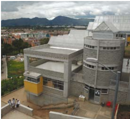
Colegio 21 Ángeles, Localidad de Suba

Es responsabilidad esencial del Estado garantizar el derecho a la educación, para lo cual se debe ocupar del aseguramiento de la gratuidad, de la suprema inspección y vigilancia con el fin de velar por su calidad, por el cumplimiento de sus fines y por la mejor formación moral, intelectual y física de los educandos, debe también garantizar el adecuado cubrimiento del servicio y el aseguramiento de las condiciones necesarias para el acceso y permanencia en el sistema educativo. Constituye compromiso indeclinable del Plan de la Ciudad y del Plan Sectorial de Educación reconocer y garantizar el derecho a una educación de calidad para los niños, niñas y adolescentes.