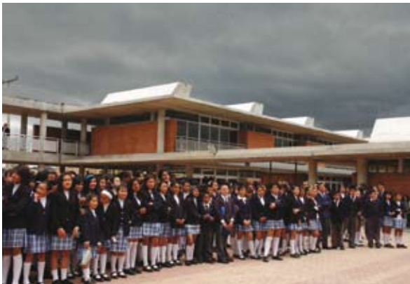
Colegio Francisco Socarrás, Localidad de Bosa

La SED ampliará los programas y proyectos dirigidos a generar opciones formativas relacionadas con el acceso al mundo del trabajo, el desempeño de la población egresada del bachillerato, la continuidad en la cadena de formación, la búsqueda de opciones para el acceso a la Educación Superior y, en general, para fortalecer la formación laboral de los jóvenes. Estas acciones buscan asegurar la continuidad y sostenibilidad de los programas iniciados en los últimos años para atender la educación de los jóvenes y superar inequidades y exclusiones existentes, en especial en los estratos 1, 2 y 3.