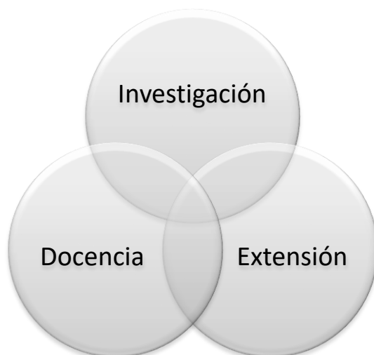
Figura 2. Procesos misionales Universidad de Córdoba.