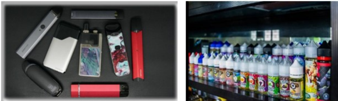
Rajah 1. Jenis-Jenis Vape

Selanjutnya, rokok vape pada dasarnya memiliki banyak jenis, berbagai bentuk dan ukuran. Contohnya, bentuk pen, portable, jam tangan, dan sebagainya. Kesannya, seseorang guru di sekolah akan sukar mengenalpasti vape yang dibawa oleh remaja kerana ia mempunyai bentuk yang unik. Oleh itu, seseorang guru perlulah membuat sedikit kajian tentang vape atau rokok elektrik tentang bentuk-bentuk yang terkini yang dijual di pasaran. Aneka bentuk dan ukuran vape disajikan pada Rajah 1.