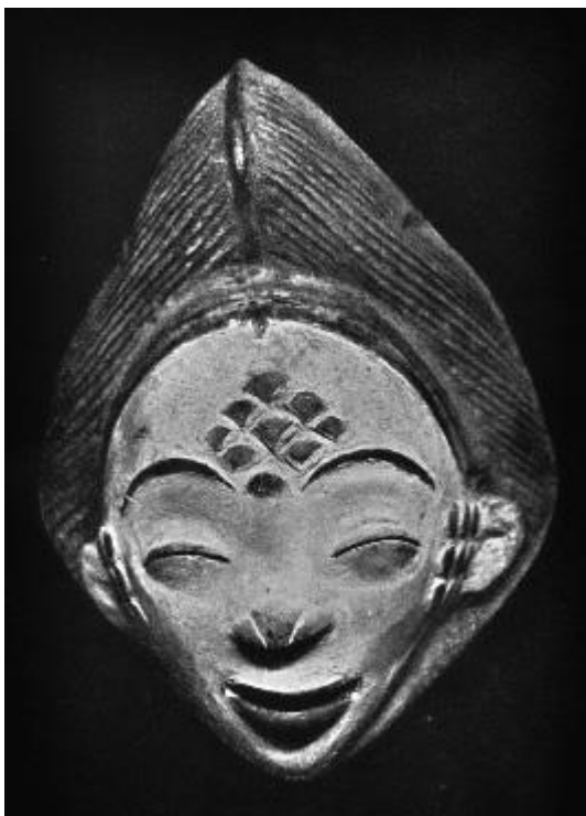
Figura 02: Máscara antropomorfa – Artista Shira, Punu ou Lumbu; Gabão