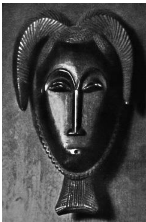
Figura 03: Máscara – Artista Yohouré; Costa do Marfim