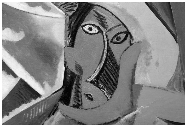
Figura 04: Fragmento do quadro Les Femmes d'Alger (O Versão O) – Pablo Picasso (1907)