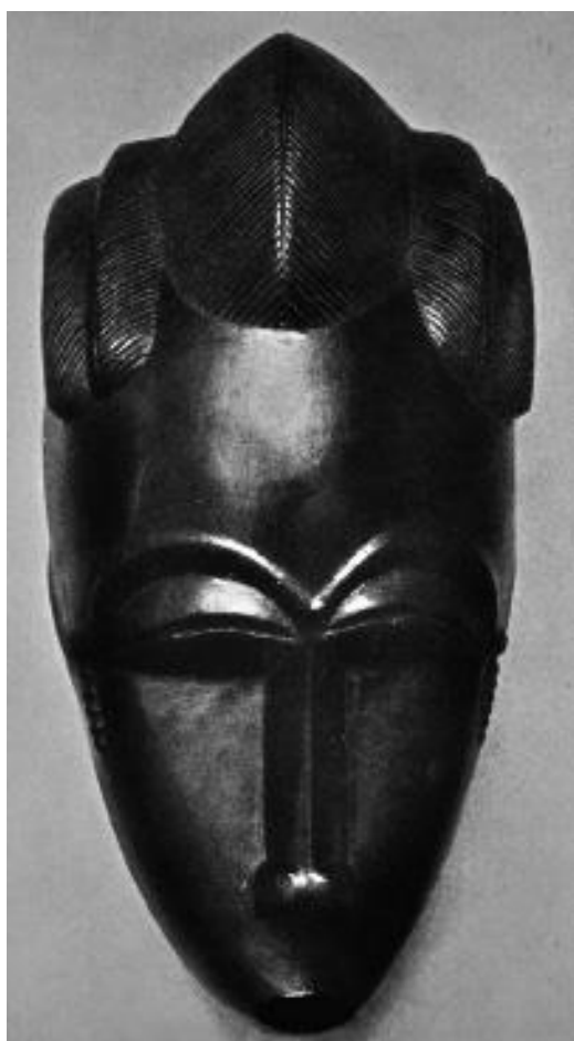
Figura 01: Máscara antropomorfa – Artista Baoulé; Costa do Marfim

Dessa forma, duas imagens de quadros de Pablo Picasso, na sua fase cubista, foram selecionadas pela professora (uma das pesquisadoras) devido à proximidade visual que tinham com as imagens escolhidas na experiência com as cinco crianças, de forma que pudéssemos relacionar as semelhanças e diferenças a partir dos elementos constitutivos da linguagem visual. Todas as imagens foram apresentadas em preto e branco para que o foco da observação fossem as linhas e as formas. A seguir, estão as imagens escolhidas para a realização dessa experiência.