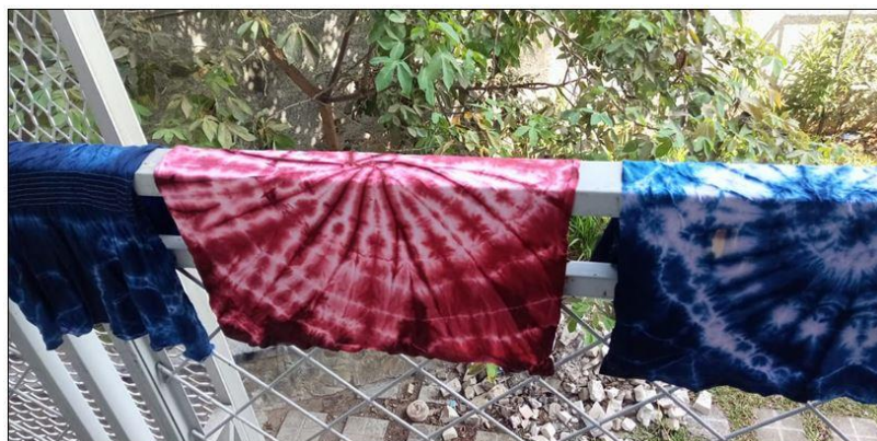
Gambar 9. Proses pengeringan baju setelah pencelupan warna tie dye yakni dengan dijemur yang diangin-anginkan supaya warna tidak pudar