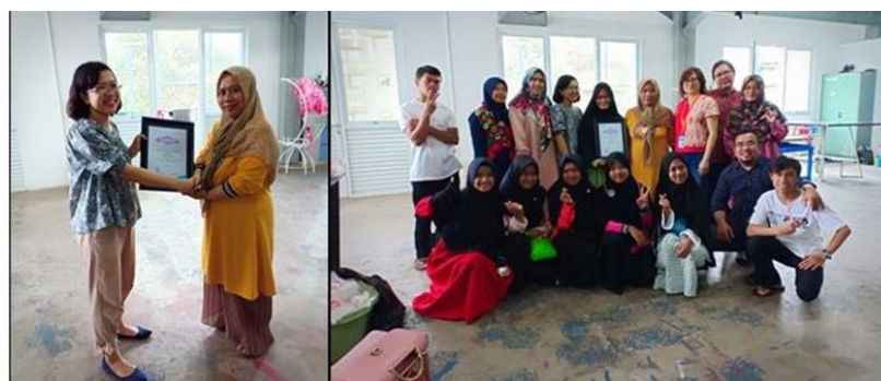
Gambar 11. Penyerahan sertifikat dan foto penutup bersama seluruh tim pelaksana dan peserta pelatihan reka tekstil tie dye dari PCNA Sukajadi, Bandung

Kegiatan ini berakhir di pertemuan kedua yakni Sabtu, 4 Mei 2019 sekitar pukul 12.00 WIB yang ditutup dengan acara berfoto bersama, penyerahan sertifikat mewakili Prodi DIII SRD, makan bersama dari konsumsi yang telah disediakan, dan selanjutnya ditutup dengan doa bersama serta ucapan terima kasih atas kesediaan peserta mengikuti pelatihan. Setelah selesai kegiatan praktik pelatihan reka tekstil tie dye , tim pelaksana membersihkan dan merapikan semua peralatan serta area ruang Workshop Tekstil dan Persepatuan yang telah digunakan dan diserahkan kembali ke Prodi DIII SRD.