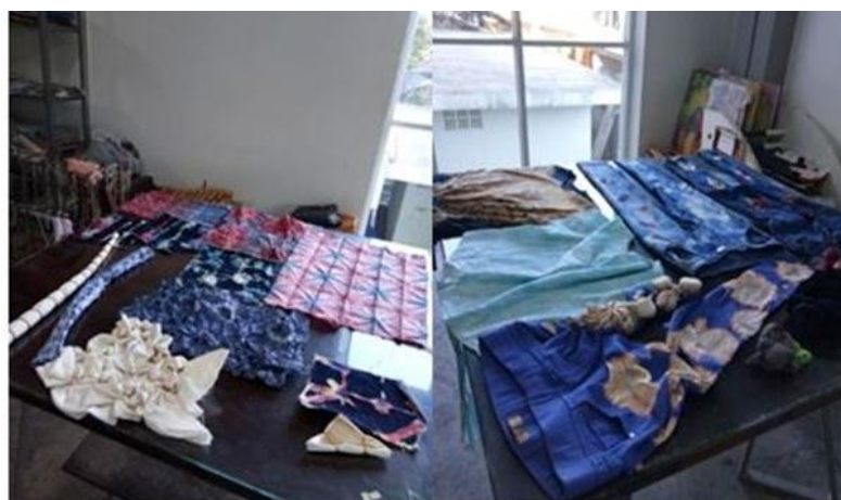
Gambar 2. Persiapan contoh-contoh hasil tie dye oleh tim pelaksana