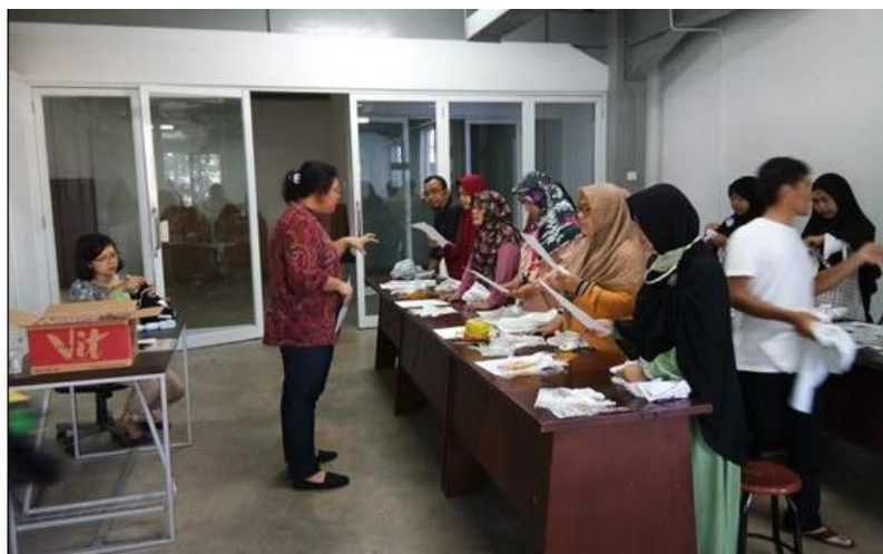
Gambar 3. Pengarahan dan pembagian kelompok kerja oleh tim pelaksana