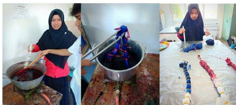
Gambar 5 . Proses pewarnaan dengan teknik tie dye panas yakni dimasak dengan larutan pewarna kain di dalam ketel/ panci