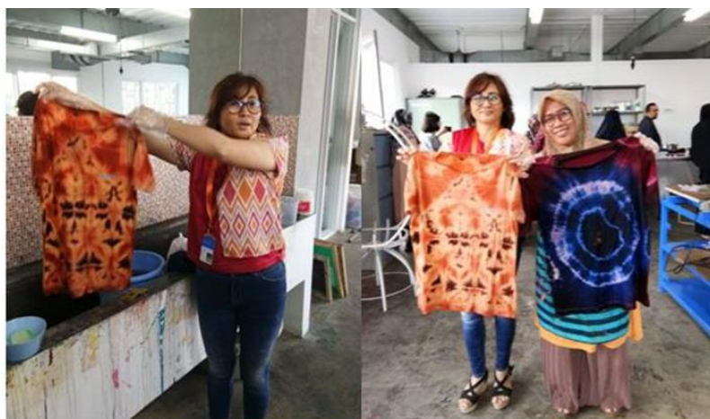
Gambar 8. Proses penetralan teknik dingin (bleaching) dengan membilas kain/ baju dengan air dingin