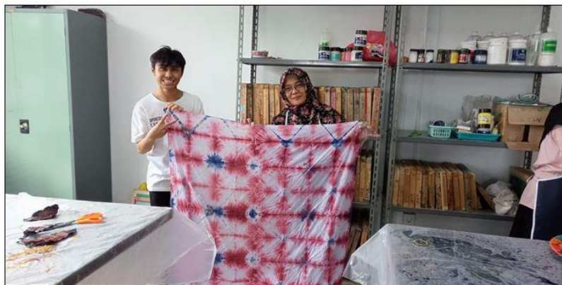
Gambar 6. Hasil celupan tie dye