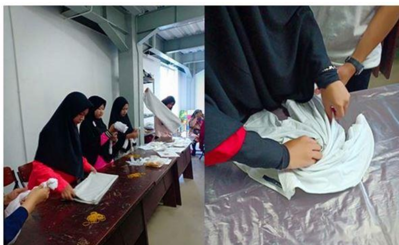
Gambar 4. Proses pembuatan pelipatan kain/ kaus sebelum pewarnaan