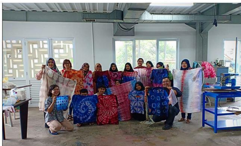
Gambar 10. Foto bersama tim pelaksana dengan para peserta bersama hasil karya masing-masing

Kegiatan ini berakhir di pertemuan kedua yakni Sabtu, 4 Mei 2019 sekitar pukul 12.00 WIB yang ditutup dengan acara berfoto bersama, penyerahan sertifikat mewakili Prodi DIII SRD, makan bersama dari konsumsi yang telah disediakan, dan selanjutnya ditutup dengan doa bersama serta ucapan terima kasih atas kesediaan peserta mengikuti pelatihan. Setelah selesai kegiatan praktik pelatihan reka tekstil tie dye , tim pelaksana membersihkan dan merapikan semua peralatan serta area ruang Workshop Tekstil dan Persepatuan yang telah digunakan dan diserahkan kembali ke Prodi DIII SRD.