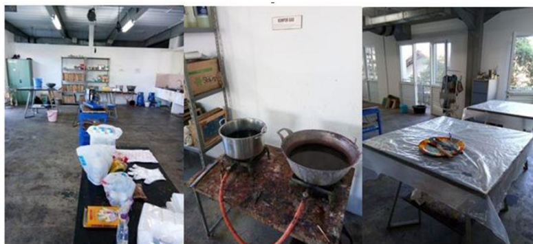
Gambar 1. Persiapan bahan dan peralatan

Seluruh aktivitas kegiatan pengabdian ini sepenuhnya dipandu oleh tim pelaksana yang terdiri atas dosen sebagai instruktur dibantu oleh dua mahasiswa. Tiap mahasiswa diberi tanggung jawab untuk mendampingi dan melatih lima peserta agar selama pelaksanaan kegiatan dapat berjalan dengan baik dan mencapai sasarannya. Selama kegiatan berlangsung, proses pelatihan dilakukan dengan santai namun serius sehingga masing-masing peserta mampu menyelesaikan pembuatan kaus, kain, bahkan kerudung masing-masing dan memperoleh hasil yang optimal. Pada akhir kegiatan, peserta dapat membawa pulang hasil buaatannya masing-masing dengan rasa bangga dan puas atas hasil pekerjaannya sendiri.