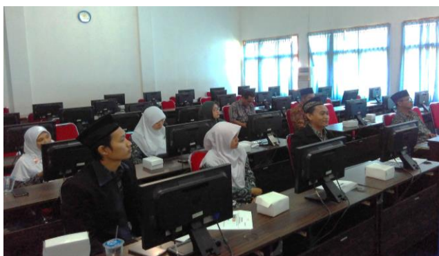
Gambar 1. Kegiatan workshop

Pelaksanaan kegiatan pengabdian masyarakat dalam bentuk pelatihan dan workshop pemanfaatan ICT berupa pembuatan, pengaturan, dan pemanfaatan blog untuk menunjang proses Kegiatan Belajar dan Mengajar (KBM) ini telah dilaksanakan sesuai dengan rencana dan jadwal yang telah disusun. Dalam kegiatan ini telah dilaksanakan serangkaian kegiatan yang terdiri dari paparan yang dilanjutkan dengan FGD ( Focus Group Discussion ) pada hari pertama, dan praktek serta workshop pembuatan, pengisian, dan pengaturan blog pada hari kedua, seperti yang terlihat pada gambar 1.