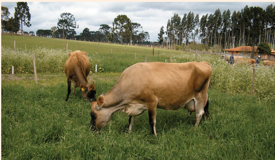
Figura 2. Início do pastejo rotativo na altura correta da pastagem formada pelo consórcio de aveia-preta, azevém e ervilhaca (30cm de altura)