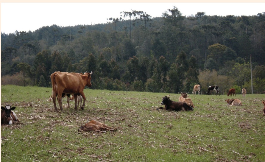
Figura 3. Pastagem anual de inverno manejada com baixa altura de pastejo e pouca área foliar – condição que representa um dos principais problemas do sistema integração lavoura-pecuária no Sul do Brasil

genótipos vegetais e animais adaptados e de alto potencial produtivo e, sobretudo, o adequado manejo da pastagem, mantendo alturas corretas de plantas, a fim de que ocorra alto rebrote, elevada qualidade forrageira e adequadas condições de solo para cultivo de plantas de lavoura em sucessão.