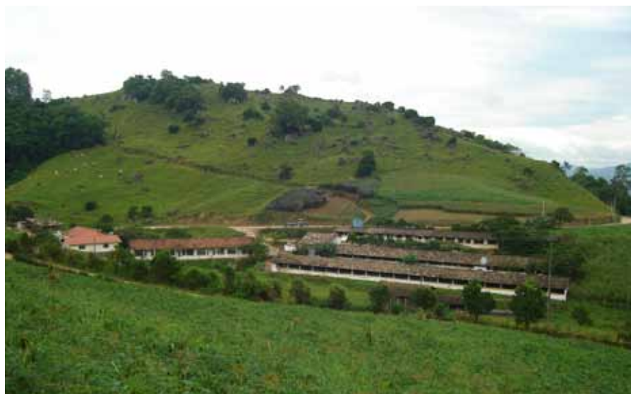
Figura 1. Vista geral de uma propriedade da microbacia do Rio Coruja/Bonito (Braço do Norte, SC), com a granja de suínos próxima à área com pastagem perene

Em amostras coletadas em anéis com 10,9cm de diâmetro e 5cm de altura (460cm 3 de volume) foram determinados: condutividade hidráulica saturada (CHS); umidade volumétrica na capacidade de campo ( UV_{cc} ); diâmetro médio ponderado aritmético dos agregados secos ao ar ( DMA_{sa} ) e estáveis em água ( DMA_{ea} ); índice de estabilidade de agregados ( IEA = DMA_{ea}/DMA_{sa} ); granulometria do solo (teor de argila, silte e areia); grau de flocculação da argila (GF ▶