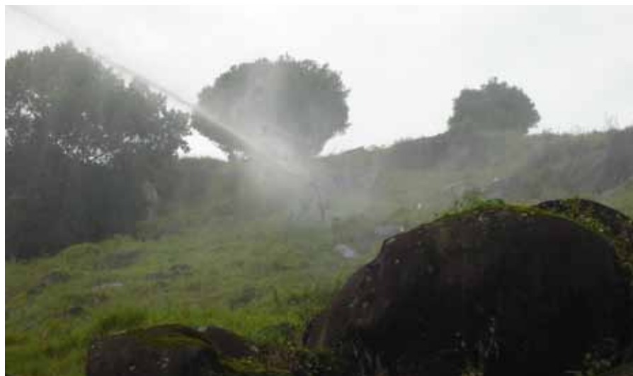
Figura 2. Distribuição de dejetos líquidos de suínos por aspersão em área com pastagem perene