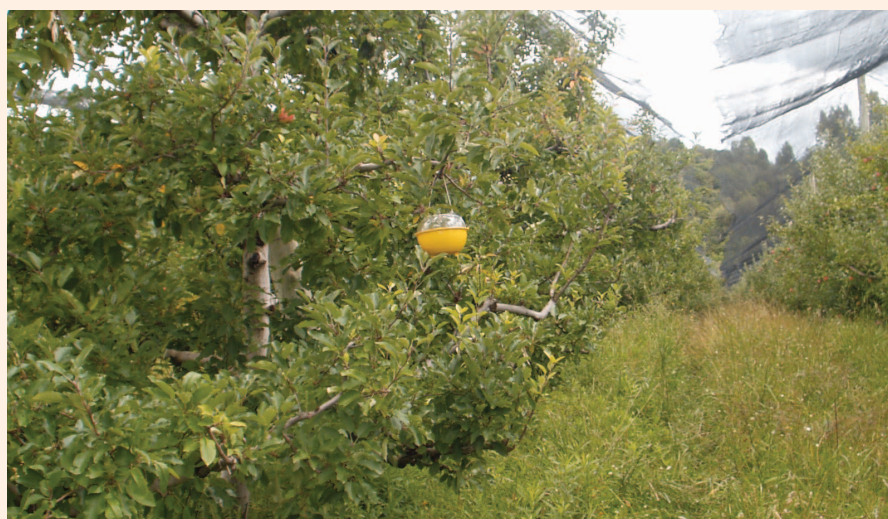
Figura 1. Altura da instalação da armadilha (1,8m do solo)

As soluções atrativas foram renovadas semanalmente, e os insetos capturados foram separados através de uma peneira de malha fina (náilon), lavados em água pura e acondicionados em frascos de plástico de 80ml, contendo álcool 70%. Em seguida, as amostras foram levadas ao Laboratório de Entomologia da Epagri/Estação Experimental de São Joaquim, SC, ▶