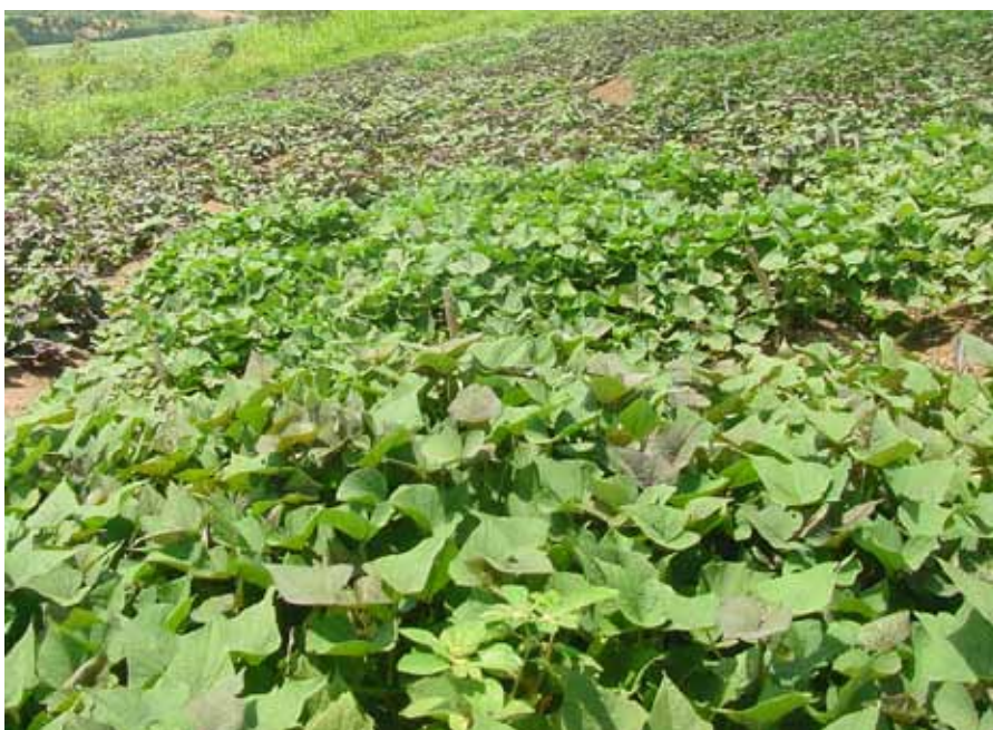
Figura 2. Campo de produção de batata-doce na Epagri/Estação Experimental de Ituporanga, 2011

As sementes obtidas deram origem a indivíduos que foram selecionados e avaliados conforme as seguintes características: produtividade, formato da raiz, cor da película e da polpa, capacidade de armazenamento e resistência às principais pragas da cultura na região, como a broca e o complexo fúngico causador do mal do pé ( P. destruens ).