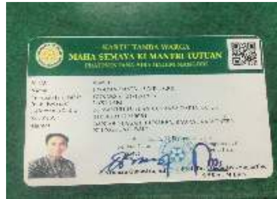
Gambar 10 Hasil Cetak Kartu Warga