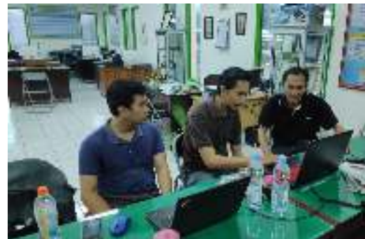
Gambar 7 Pelatihan Kepada Mitra Sekretariat Warga Maha Semaya Ki Mantri Tutuan

Selain pengujian sistem, dilakukan juga pelatihan kepada mitra dalam menggunakan sistem yang telah dibangun. Pelatihan ini memiliki tujuan membantu mitra beradaptasi dalam pengoperasian sistem yang telah dibangun