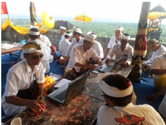
Gambar 9 Penerapan Sistem Informasi Manajemen Warga Ki Mantri Tutuan

Setelah melakukan tahap pelatihan, selanjutnya sistem informasi manajemen data iuran diimplementasikan untuk mencatat data warga dan iuran warga (Gambar 9 dan Gambar 10). Sistem informasi diakses melalui alamat http://www.tutuan.or.id . Setiap pembayaran iuran dan dana punia warga saat piodalan pura dicatat melalui aplikasi. Aplikasi kemudian dapat menghasilkan bukti pemayaran yang telah dimasukan. Setiap warga juga mendapatkan kartu warga dilengkapi dengan QR Code yang dapat digunakan sebagai pengenalan saat melakukan pembayaran.