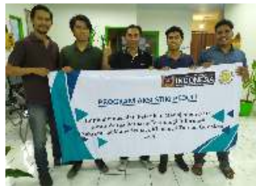
Gambar 8 Foto Bersama Pengurus Sekretariat Warga Maha Semaya Ki Mantri Tutuan

Proses pelatihan kepada mitra dilakukan selama dua hari. Pada hari pertama materi pelatihan yang diberikan berupa pengelolaan data warga pada sistem yang telah dibangun. Data warga yang dimiliki oleh sekretariat dimasukan ke dalam sistem. Hari kedua dilakukan pelatihan tentang pencatatan pembayaran iuran warga. Hari ketiga pelatihan