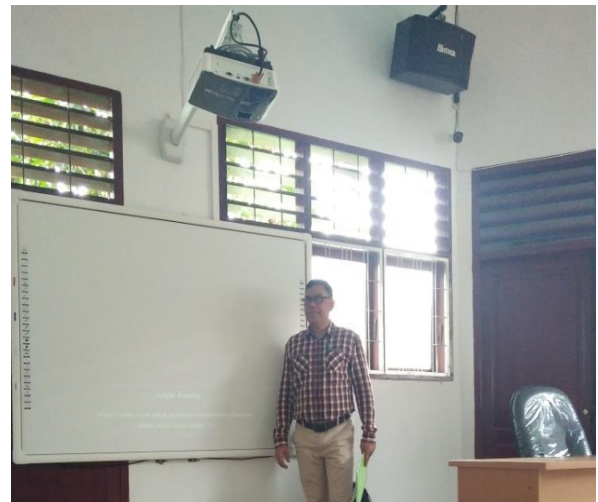
Gambar 6. Pengenalan Interactive White Board

Tahap ketiga adalah mengajak beberapa guru untuk menggunakan langsung laboratorium microteaching khususnya penggunaan interactive white board . Seperti gambar berikut.