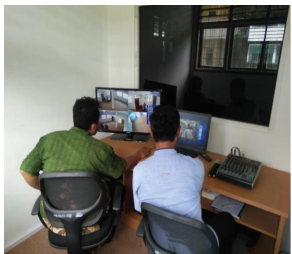
Gambar 3. Ruang Operator