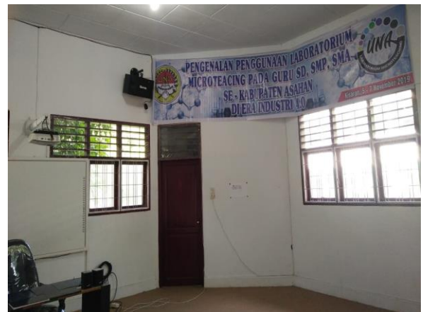
Gambar 7. Dokumentasi Kegiatan