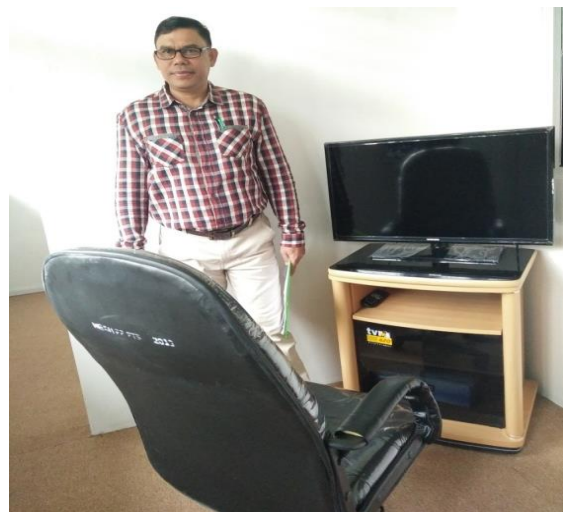
Gambar 1. Ruang Observasi

Alat yang tersedia pada tiga ruangan tersebut seperti pada gambar berikut.