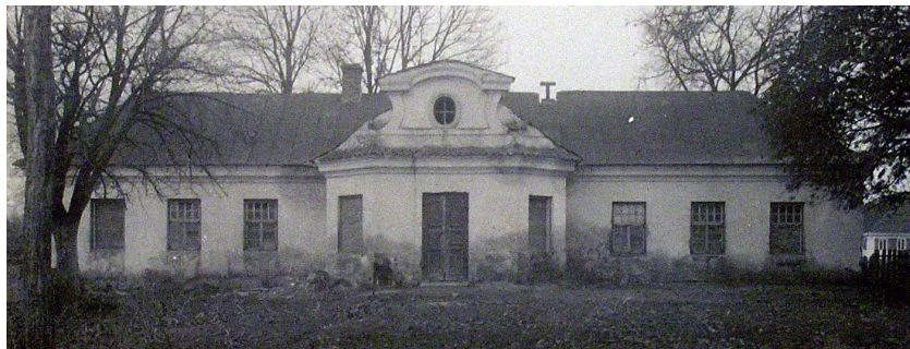
Іл. 2. Плебанія в місті Ізяслав. Фото другої половини 20-х років XX ст.