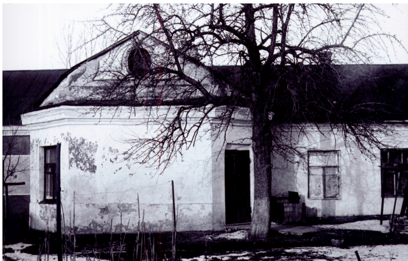
Іл. 4. Плебанія. Фото другої половини XX-го століття