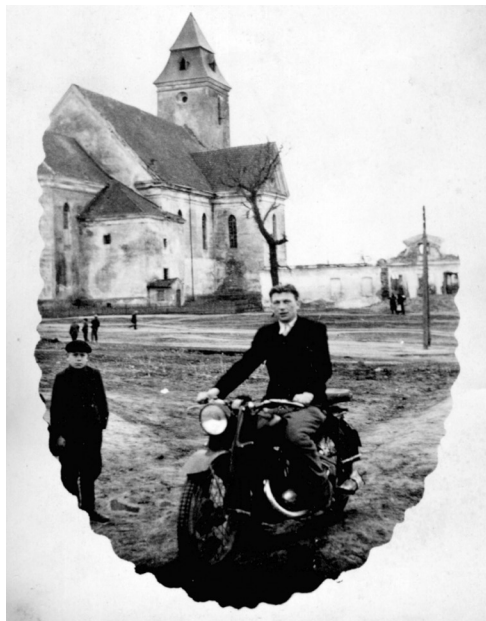
Іл. 3. Костел Іоанна Хрестителя і плебанія в місті Ізяслав. Фотографія. Приблизно друга половина 40-х років XX століття