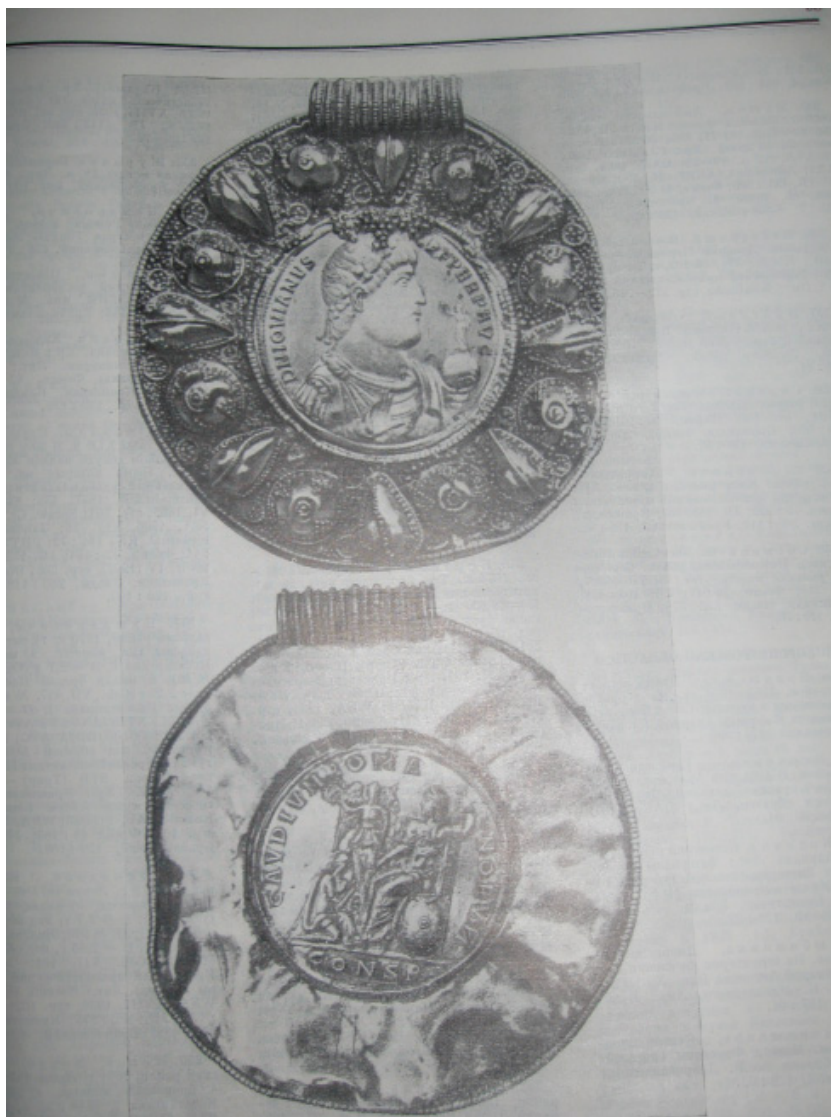
Золотий медальйон імператора Клавдія Йовіана (363-364 рр. н. е.)