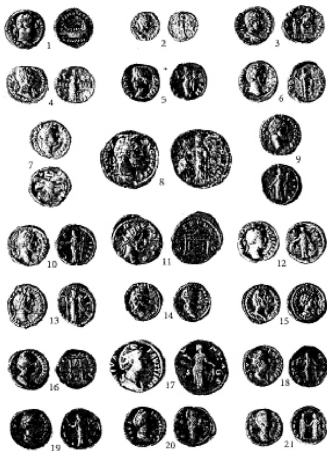
Римські монети зі скарбів Волині: 1, 3, 4 – срібні денарії Адріана; 2 – срібний квінтарій Адріана; 5, 6 – срібні денарії Емілія Вера; 7, 9, 10, 12, 13 – срібні денарії Антоніна Пія; 8 – мідний ас Антоніна Пія; 11 – срібний ауреус Антоніна Пія; 14, 15 – срібні денарії Антоніна Пія і Марка Аврелія; 16, 18–21 – срібні денарії Фаустини Старшої; 17 – мідний ас Фаустини Старшої