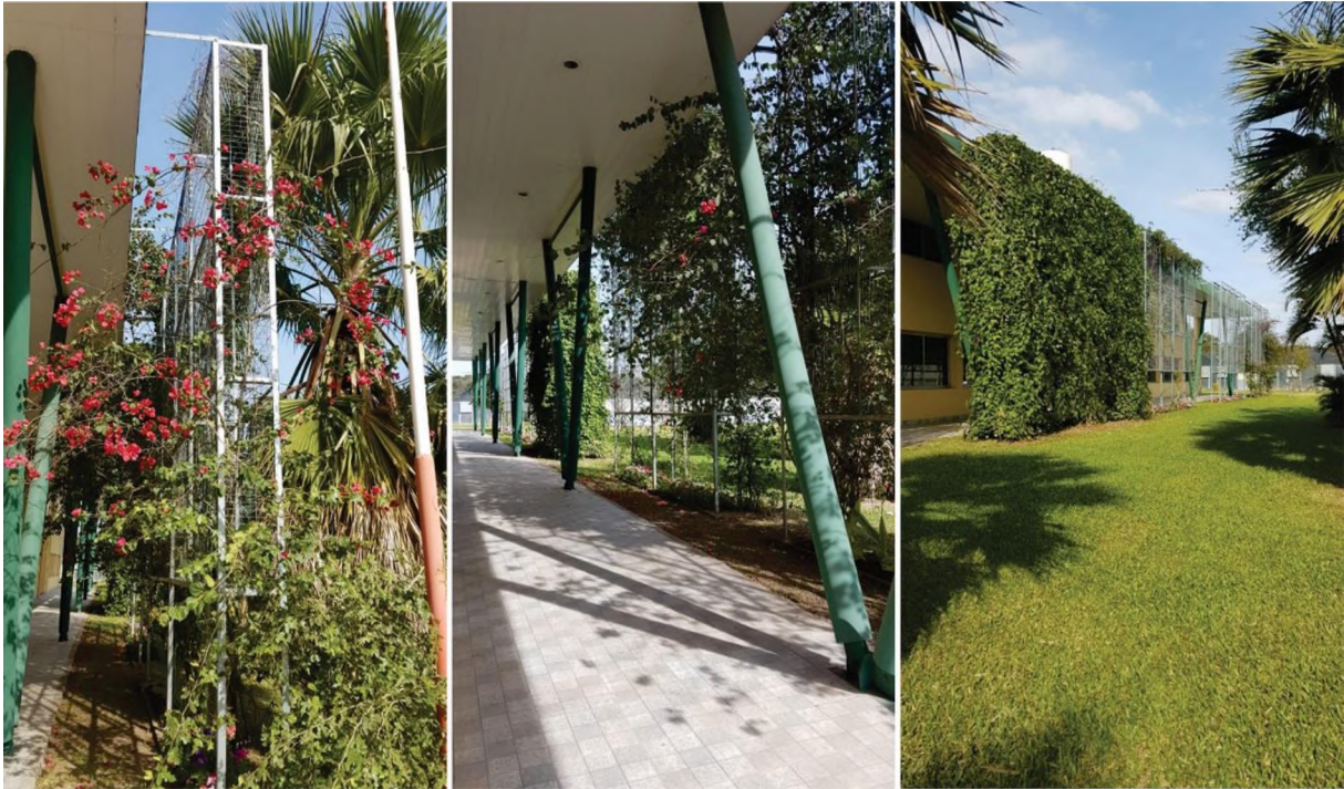
Fig. 7: A la izquierda detalle de la estructura, en el medio, fotografía de la espacialidad de la galería con la piel verde y a la derecha el resultado de la fachada lateral del edificio.