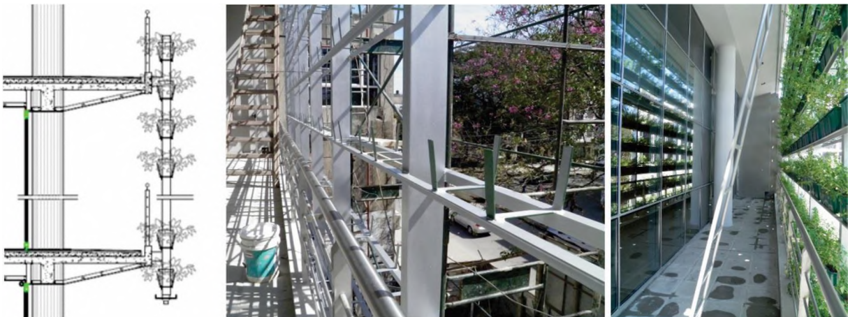
Fig. 5: aspectos tecnológicos del parasol verde.

En la Fig. 5 se observa de izquierda a derecha: detalle tecnológico del parasolado verde, en el medio proceso de construcción de la estructura soporte y a la derecha la colocación de las jardineras con arbustos.