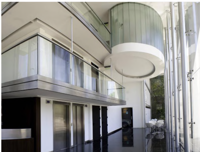
Fig. 1: Vista desde el interior donde se vivencia el muro verde en la Torre Vista.