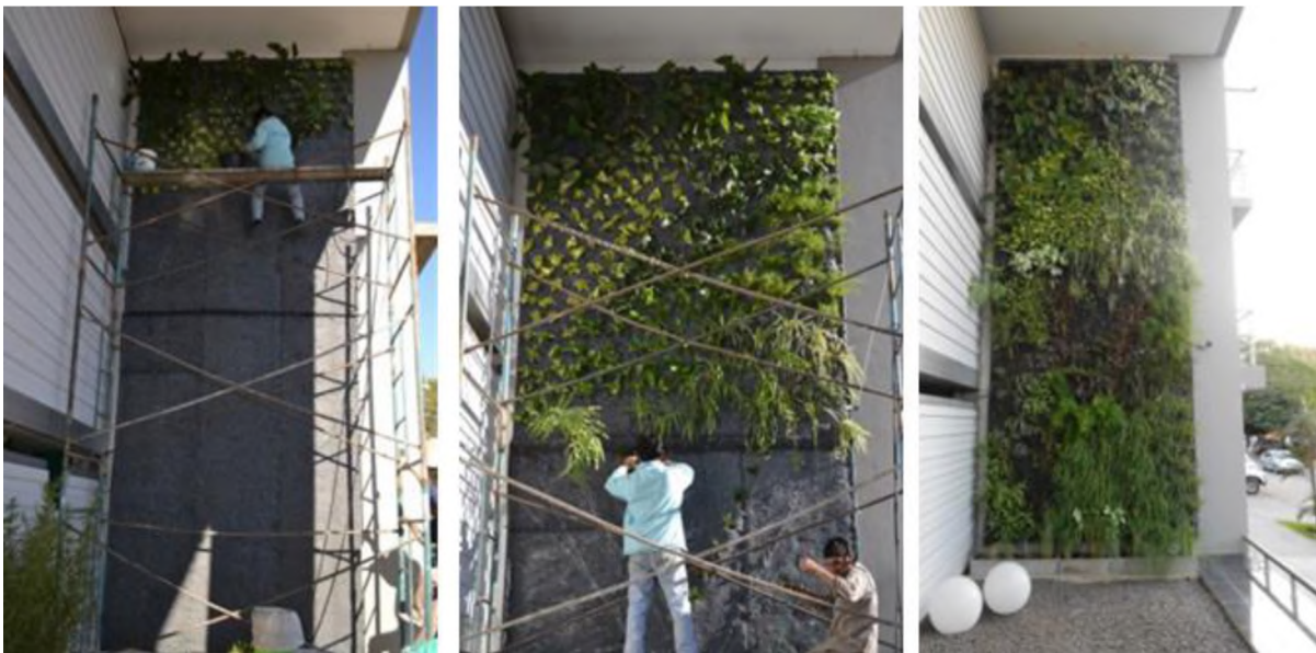
Fig. 2: Proceso de construcción del muro verde.

En cuanto a la construcción del muro verde se trata de un Sistema Hidropónico tecnológicamente resuelto de interior a exterior de la siguiente manera: muro soporte, estructura metálica, placas de PVC, fieltro geotextil reciclado, geotextil con protección ultravioleta y plantas según diseño del jardín. Además posee un sistema de riego automatizado y un sistema de recolección del agua (Fig. 2 y 3).