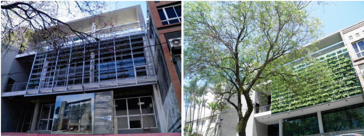
Fig. 4: Fachada del edificio. A la izquierda durante el proceso constructivo y a la derecha el resultado final.

El parasolado “verde” corresponde al sector del auditorio, se materializa con jardineras que contienen arbustos (lantana) que requiere bajo mantenimiento, en base a un detallado esqueleto que soporta las macetas y a la vez que permite el pasaje de las instalaciones de riego automatizado.