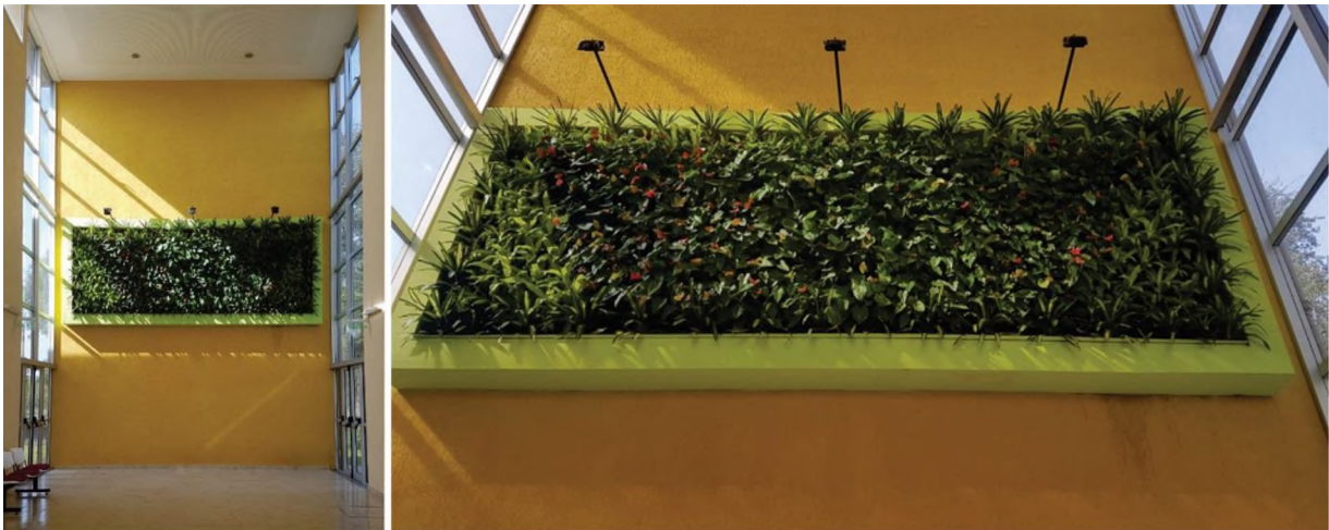
Fig. 6: A la izquierda el cuadro verde en el espacio y a la derecha detalle de vegetación.

El muro verde de interior se expresa como una obra de arte natural de 6 metros de ancho por 2 de alto, a modo de "cuadro vivo". En la Fig. 6 se observa a la izquierda la magnitud de la intervención, en un espacio de doble altura.