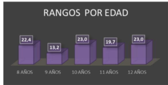
Gráfico 2. Distribución en porcentajes de los grupos de edad

concentración de las respuestas está dada entre las edades de 8 a 12 años, como se evidencia en el grafico 2, la edad de 9 años representa un porcentaje de significancia más baja ya que posee un porcentaje del 13%, seguido de la edad de 11 años con un porcentaje de 19% las edades de 8,10 y 12 años tienen una consistencia más homogénea.