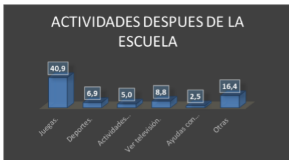
Gráfico 5. Actividades desarrolladas por los niños en el tiempo libre

La actividad realizada durante la semana fuera de clase y que presenta mayor recurrencia por parte de los encuestados se puede apreciar en el grafico 5, son los juegos con un 49,9%, seguido de otras actividades con un 16% al indagarse sobre cuáles son estas otras actividades se centran en las tareas de estudio dejadas en los colegios, otros datos de referencia corresponde a ver televisión con un 8,8% y los juegos en un 16%, y el de un menor agrado pero significativo se encuentran la práctica de un deporte con solo 6,9% y las actividades artísticas con aproximadamente el 5%.