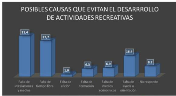
Gráfico 10: causas que evitan el desarrollo de actividades recreativas por parte de los niños

Obsérvese el gráfico 11 de la distribución de con quienes participan los niños en las actividades recreativas, los encuestados manifiestan que una mayor tendencia a realizar las actividades con la familia en un 27,7 % porcentaje de hecho muy bajo para la edad en la que se realiza el estudio, el porcentaje de actividades realizadas que sigue corresponde a las actividades desarrolladas con un grupo de amigos 23,3% y un 15,7% para las actividades identificadas con los compañeros de estudio, de igual manera la distribución también indica que en un 17% los niños realizan actividades que consideran recreativas de manera solitaria y en esta misma tendencia en dependencia de que si hay o no compañía un 11,3% lo que deja de manifiesto que la individualidad de las actividades es alta si se tienen en cuenta que elementos como el egocentrismo esta planteadas para edades más tempranas.