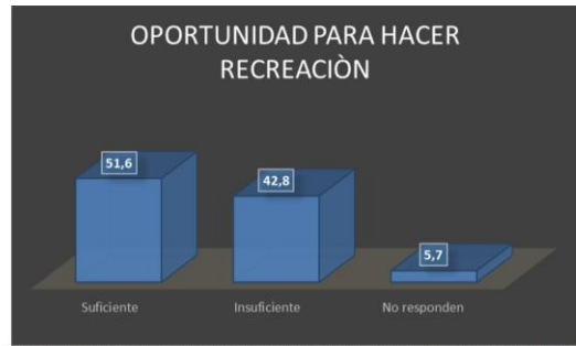
Gráfico 8. Representación de la apreciación si el sector donde se habita permite la oportunidad de realizar actividades recreativas

Posición 2: aquí se evidenció que el sector donde viven no tiene opciones para desarrollar actividades recreativas esta posición alcanzó un porcentaje de 42,8% Existe un porcentaje 5,7 % que no presento respuesta.