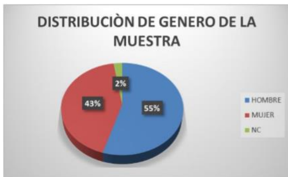
Gráfico 1. Distribución de la muestra por género

Como se observa en el grafico 1 del total de encuestados un 43 % representan al género femenino y un 55 % al género masculino, mientras que un 2% se abstuvo de contestar la pregunta, evidenciándose una muestra homogénea para la aplicación de los instrumentos para ambos sexos de la muestra.