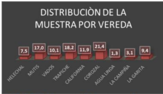
Gráfico 4. Distribución porcentual de la muestra por veredas