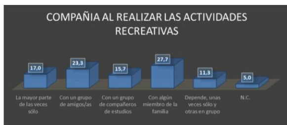
Gráfico 11. Compañía con la que se realizan las actividades recreativas

Obsérvese el gráfico 11 de la distribución de con quienes participan los niños en las actividades recreativas, los encuestados manifiestan que una mayor tendencia a realizar las actividades con la familia en un 27,7 % porcentaje de hecho muy bajo para la edad en la que se realiza el estudio, el porcentaje de actividades realizadas que sigue corresponde a las actividades desarrolladas con un grupo de amigos 23,3% y un 15,7% para las actividades identificadas con los compañeros de estudio, de igual manera la distribución también indica que en un 17% los niños realizan actividades que consideran recreativas de manera solitaria y en esta misma tendencia en dependencia de que si hay o no compañía un 11,3% lo que deja de manifiesto que la individualidad de las actividades es alta si se tienen en cuenta que elementos como el egocentrismo esta planteadas para edades más tempranas.