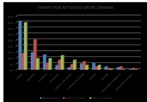
Gráfico 6. Porcentaje de tiempo destinado por los niños al desarrollo de diferentes actividades entre los días lunes y viernes

En menor medida la muestra identifica predilección por destinar tiempo a la práctica deportiva que es seguida por las actividades recreativas artísticas y por ver televisión, la información se puede analizar con detalle en el grafico 6.