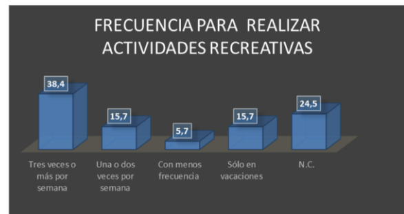
Gráfico 9. Frecuencia de práctica de las actividades recreativas

Con relación al indicador de la frecuencia con las que se realizan las actividades recreativas los estudiantes entre 8 y 12 años en el sector rural del municipio de los Patios se evidencia que del total de encuestados el 38,4% respondió que realizaba este tipo de actividades tres o más veces por semana y aproximadamente el 24,5% no respondió el 15,7% afirma realizarlo una o dos veces por semana y con menos frecuencia el 5,7%. Del total que se evidencian en el gráfico 9.