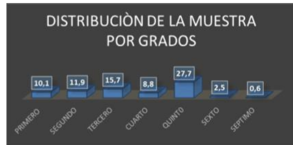
Gráfico 3. Distribución de la muestra por cada uno de los grados

Es necesario resaltar que pese a que el escenario de estudio se centró en los grados de 2° al 5°, que son los grados donde se estimaba encontrar las edades predeterminadas para el estudio se puede observar en el gráfico 3, el 10,1% de la muestra obedece a los grados de primero y un 3% aproximado para los grados de sexto y séptimo.