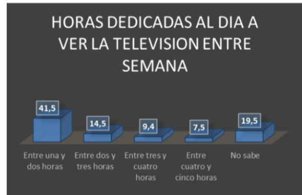
Gráfico 12. Tiempo dedicado a ver televisión de lunes a viernes

horas a ver televisión, y existen unos porcentajes menores observados en la gráfica 12, que muestran tiempo superiores frente a la pantalla chica, datos que se deberán entrar a profundizar en las fases subsiguientes de la investigación.