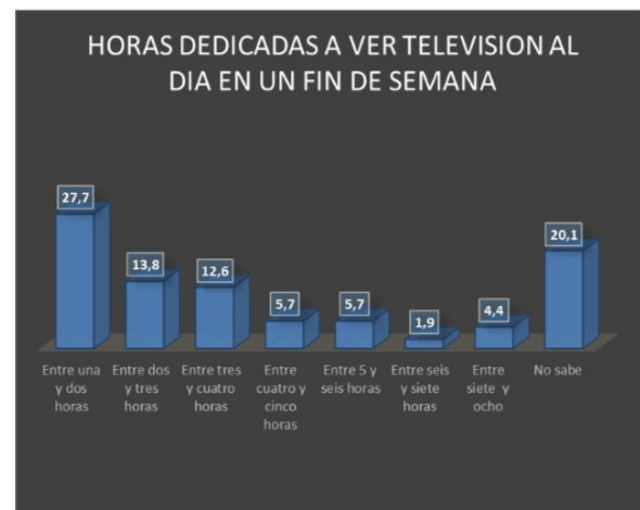
Gráfico 13 Tiempo dedicado a ver televisión los fines de semana y días festivos

En esta misma perspectiva se identifica la tendencia en cuanto a la actividad de ver televisión expresada en horas para los fines de semana y los días feriados, presentando un descenso con relación a los demás días de la semana en la franja de entre una y dos horas 27,7% y la de dos y tres horas 13% pero incrementándose el tiempo dedicado a ver televisión como se puede apreciar en la gráfica 13.