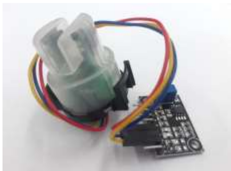
Gambar 5. Sensor kekeruhan air (Turbidity Sensor Module)

Untuk parameter kekeruhan kami menggunakan sensor kekeruhan air atau Turbidity yang disajikan pada Gambar 5. Secara umum, prinsip kerja dari sensor ini berdasarkan prinsip transmisi cahaya dan sangat cocok untuk kondisi lingkungan yang dinamis [7]. Sedangkan, untuk detail spesifikasinya dapat dilihat pada Tabel 3.