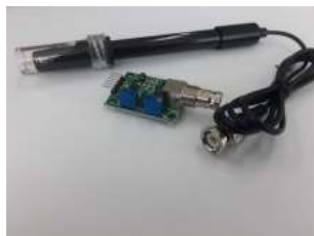
Gambar 3. Sensor pH liquid

Penelitian ini menyajikan analisa studi tentang sensor-sensor dan modul IoT yang akan digunakan untuk mengukur, mengakuisisi, dan menyimpan data kualitas air PDAM. Terdapat lima parameter kualitas air PDAM yang akan diukur yakni pH, suhu, kekeruhan, konduktivitas dan kadar kontaminasi, yang dimonitoring dari beberapa sebaran titik sampel lokasi di Surabaya. Untuk parameter pH, kami akan menggunakan sensor pH liquid yang dapat dilihat pada Gambar 3. Sensor pH liquid memiliki range pengukuran dari pH 0 sampai dengan 14 yang artinya sensor ini dapat mengukur kadar larutan dari level asam hingga basa. Untuk detail spesifikasi dari sensor pH liquid telah disajikan pada Tabel 1.