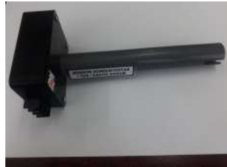
Gambar 6. Sensor Konduktivitas

Sensor konduktivitas yang diperlihatkan oleh Gambar 6 dapat diaplikasikan sebagai sensor konduktivitas, kemurnian air, kontaminasi air, kadar garam, salinitas, dan lain-lain. Pada penelitian ini sensor tersebut digunakan untuk mengambil data parameter konduktivitas dan kemurnian pada kualitas air PDAM. Tabel 4 menyajikan detail spesifikasi dari sensor konduktivitas.