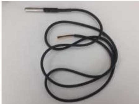
Gambar 4. Sensor Suhu DS18B20

Spesifikasi dari Sensor suhu DS18B20 disajikan pada Tabel 2.