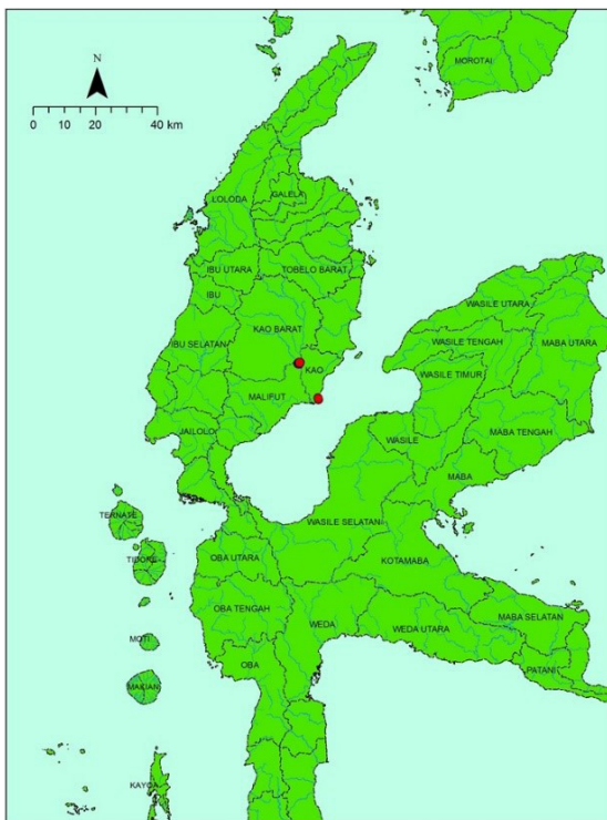
Gambar 1. Lokasi Situs Kampung Tua Kao

Di pedalaman Kao terdapat ragam makam kuno, keramik, dan data artefaktual lainnya. Hal ini membuktikan bahwa jaringan perdagangan Islam telah mencapai daerah pedalaman Pulau Halmahera, Selain sebagai pusat penyebaran Islam, sekaligus pusat aktivitas niaga tempat memasarkan komoditi dan memperoleh produk lokal (Tim Penelitian 2014; Handoko et al. 2016; Handoko 2017, 106). Penelitian ini menitikberatkan pada kajian arkeologi lanskap dan lingkungan pada situs permukiman kuno Kampung Tua Kao, yang terletak di wilayah pedalaman Halmahera Utara dan berkarakter situs permukiman tepian sungai. Kajian ini pada prinsipnya menjelaskan bagaimana kondisi lanskap dan lingkungan menjadi pertimbangan dalam pemilihan lokasi hunian, bahkan kemungkinan menjadi faktor determinasi sebagai salah satu pusat islamisasi di wilayah Halmahera Utara.