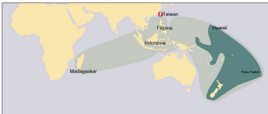
Peta 1. Peta persebaran Penutur Austronesia di Polinesia, Pasifik, Asia Tenggara hingga pantai timur Afrika (Diamond 2000)

sebagai dasar pemahaman kontekstual, sekaligus sebagai pedoman dalam penentuan strategi dan rancangan komprehensif penelitian. Kegiatan ini disusul oleh penyelenggaraan seminar nasional dan internasional, penelitian lapangan, dan publikasi (Simanjuntak 2011).