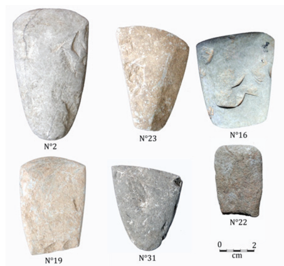
Foto 1. Variasi tipe beliung persegi dari Situs Pain Haka

Salah satu sumber data terbaru tentang kehadiran dan kehidupan Penutur Austronesia awal berasal dari Situs Pain Haka, di wilayah Kecamatan Tanjung Bunga, Kabupaten Flores Timur. Situs yang terletak di bagian ujung semenanjung dan yang jauh dari permukiman sekarang ini merupakan situs yang sangat penting untuk mengisi kelangkaan data dari Flores. Penelitian kerjasama Puslit Arkenas dan IRD yang masih berlangsung hingga kini menggambarkan situs hunian pantai dengan penguburan di dalam tempayan dan penguburan tanpa wadah. Temuan asosiasi berupa cangkang moluska dan sisa ikan membuktikan adanya pemanfaatan biota laut. Sejumlah kecil jenis cangkang tertentu bahkan dimanfaatkan sebagai bahan baku perhiasan atau ornamen. Penemuan beberapa beliung persegi dari batuan