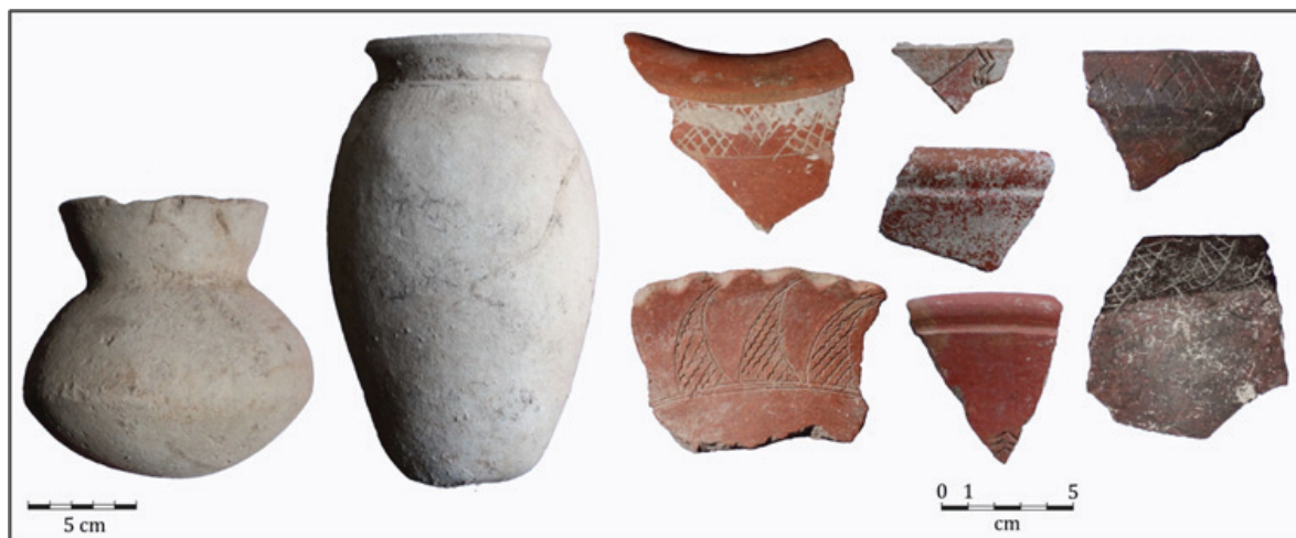
Foto 4. Gerabah polos dan motif hias dari Situs Sulengwaseng (Fauzi et al. 2012)

oleh sebaran pecahan-pecahan tembikar di permukaan. Tetua adat desa hingga kini masih menyimpan periuk-periuk dan salah satu di antaranya berisikan tulang-tulang manusia. Benda-benda ini merupakan hasil penggalian ketika tahun 2011, di permukaan tanah di jalan setapak menuju pantai yang tererosi air hujan, tersingkap tepian periuk. Ekskavasi yang kami lakukan di sekitar penggalian menemukan lapisan hunian setebal \pm 80 cm dengan tinggalan berupa pecahan-pecahan tembikar yang cukup padat disertai beberapa periuk utuh, cangkang-cangkang moluska, pahat dan calon beliung persegi ( plank ), batu yang diduga berfungsi sebagai pemukul kulit kayu untuk pembuatan kain ( bark-cloth stone beater ), serta use-ground stone tools (mis. batu pipisan, asahan, penumbuk) yang berkaitan dengan aktivitas pengolahan makanan dan perbengkelan.