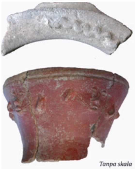
Foto 2. Motif zoomorfik (ular ?) dan antropomorfik (wajah) dari situs Pain Haka, Flores Timur (Galipaud et al. 2010 dan LPA 2012)

Jika penemuan dari Pain Haka membuktikan keberadaan Penutur Austronesia