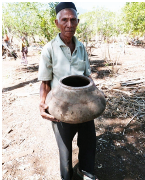
Foto 3. Penduduk Lembata menunjukkan periuk prasejarah yang disimpannya