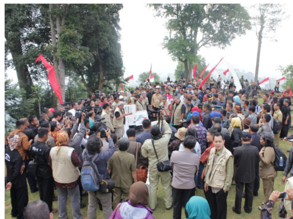
Foto 2. Menjelang kunjungan Presiden SBY berpidato di Situs Gunung Padang.

tidak dibatasi waktu. Mengutip pandangan para ahli, bahwa konflik seringkali merupakan bagian dari solusi atas suatu permasalahan yang sukar terpecahkan. Artinya, jika konflik tersebut dikelola secara benar, maka bukan tidak mungkin akan dapat mendorong ke arah perubahan yang diperlukan (Kiesberg 1992: 4; Fisher 2000: 6). Bahkan konflik fungsional seringkali menjadi prasyarat yang diperlukan untuk mencapai perubahan sosial yang lebih baik (Thung 2005: 82). Melihat hasil pemetaan konflik warisan budaya Gunung Padang, belum dapat diprediksi apakah konflik ini merupakan konflik fungsional atau justru sebaliknya disfungsional. Dalam kondisi sekarang ini, tidak seorang pun berani menebak, apakah konflik Gunung Padang masih akan berlanjut hingga tuntas atau berhenti sampai di sini. Hanya yang jelas, konflik Gunung Padang terjadi karena perbedaan persepsi dalam memaknai warisan budaya yang masing-masing pihak merasa paling benar pendapatnya. Dalam ranah ilmu pengetahuan, perbedaan pandangan atau perbedaan pendapat merupakan hal yang biasa.