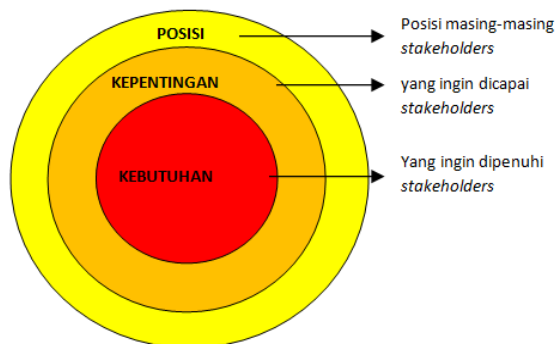
Gambar 1. Analisis Model Bawang.

mempunyai kebutuhan yang berbeda. Jika kebutuhan dasar dari berbagai pihak tersebut tidak terpenuhi, maka konflik dapat terjadi. Dengan demikian yang penting dilakukan adalah mengidentifikasi subjek dari berbagai pihak ( stakeholders ) dan memahami apa kebutuhan masing-masing yang diharapkan dari Situs Gunung Padang. Salah satu alat bantu menganalisis identifikasi kebutuhan dari berbagai pihak yang terlibat dalam pengelolaan Situs Gunung Padang tersebut, adalah analisis bawang bombay, sebagaimana disarankan oleh Fisher et al. (2000: 17-27).