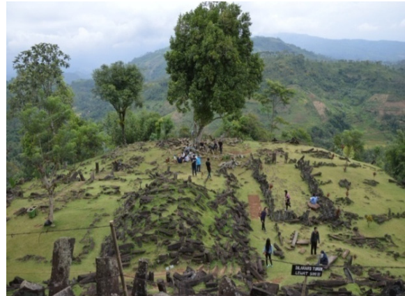
Foto 1. Warisan Budaya Situs Gunung Padang.

Faktor penyebab konflik tersebut tidak dapat dilihat secara sepihak, karena dilatarbelakangi oleh sejarah sistem