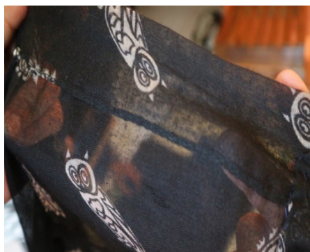
Gambar 1. Kebaya Hasil Manual (Pakai Tangan)

Rancangan kebaya yang dibuat oleh penjahit ada dua macam, yaitu secara manual dan dengan mesin. Hasil wawancara dengan ibu Tawen Sumitro, dia adalah istri dari bapak kuncen yaitu pa Sumitro sebagai penjahit yang menggunakan tangan. Pola dari pakaian tersebut hanya mengukur dari pakaian yang sudah ada sehingga tidak menyulitkan dalam mengukur badan. Proses pembuatan yang dilakukan bu Tawen yaitu dengan menjelujur dan bagian lipatan bawahnya di sum. Tetapi bahan yang sering digunakan menggunakan bahan yang agak transparan atau tipis sehingga mempermudah pembuatan kebaya tersebut. Berikut gambar kebaya hasil jahitan tangan pada salah satu bagiannya: