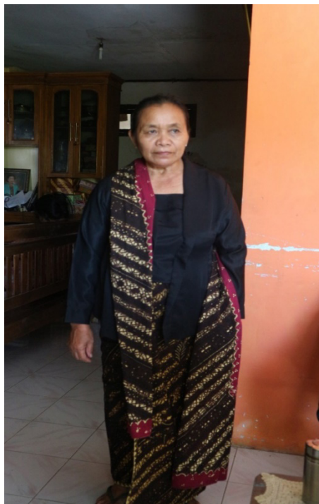
Gambar 4. Hasil Kebaya berdasarkan Pola

Dari gambar tersebut pola dapat tempelkan diatas kain yang disediakan kemudian di gunting berdasarkan pola yang sudah dibuat, setelah itu baru dijahit. Berikut gambar kebaya yang sudah jadi yang dipakai dalam kegiatan ritual keagamaan.